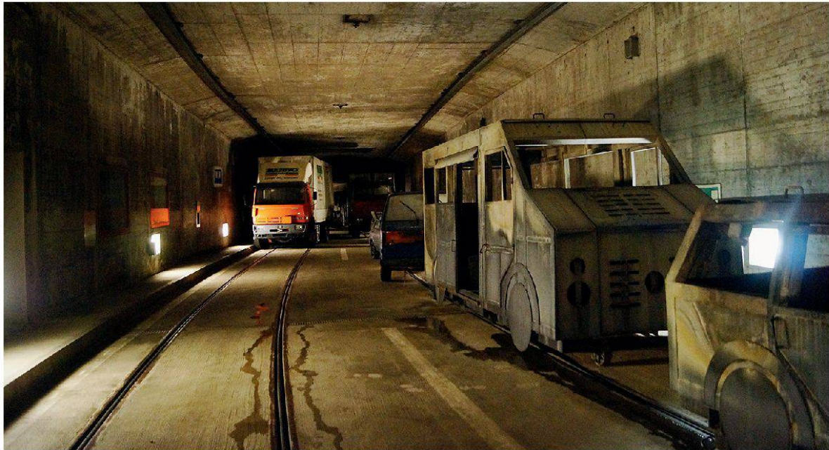
Abbildung 2: Eigentlicher Brandherd. Die beiden Stahldummies vorne rechts, können durch kontrolliert entweichendes Gas in Vollbrand gesetzt werden. Dadurch können Brandsituationen im realen Umfeld, bei Temperaturen von mehreren 100°C trainiert werden.