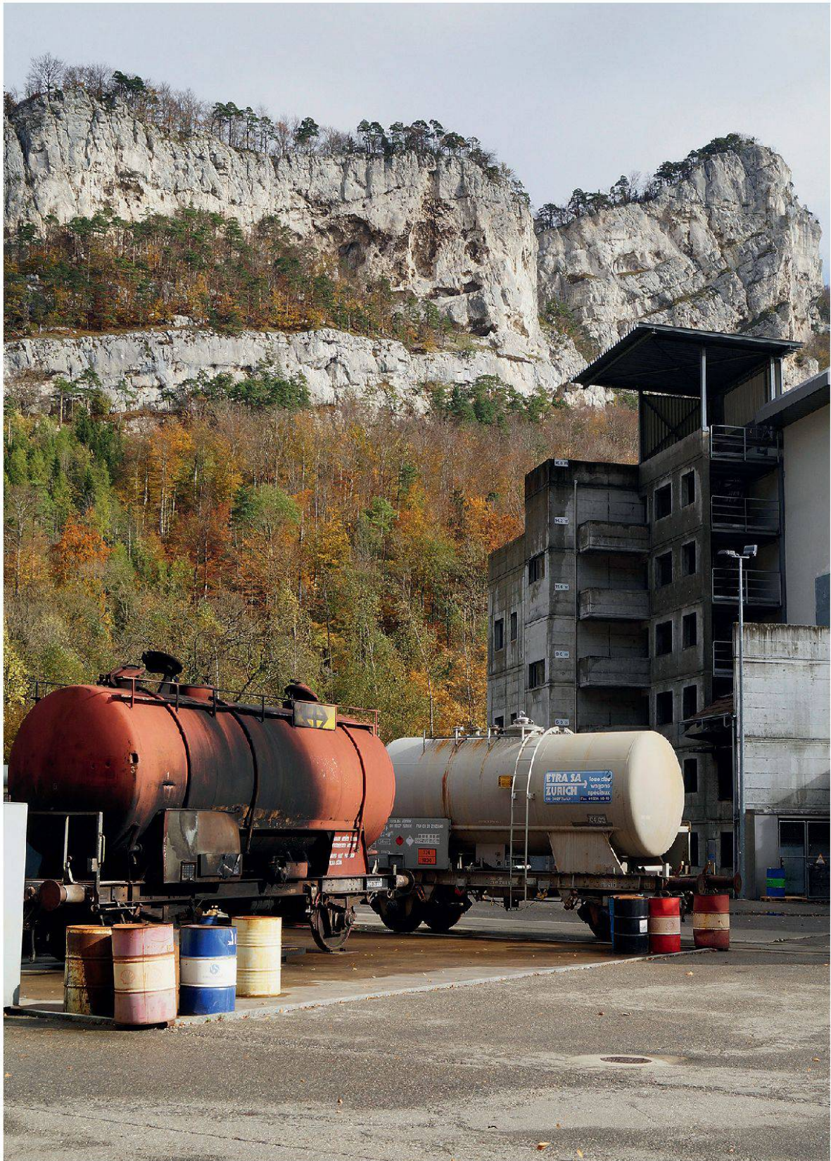
Abbildung 4: Brandplatz mit mehrstöckigem Übungsgebäude und Güterwagen mit Gefahrgütern. Die Brandspuren an Gebäude und Güterwagen illustrieren die Übungstätigkeiten auf dem ifa-Gelände in der Klus.