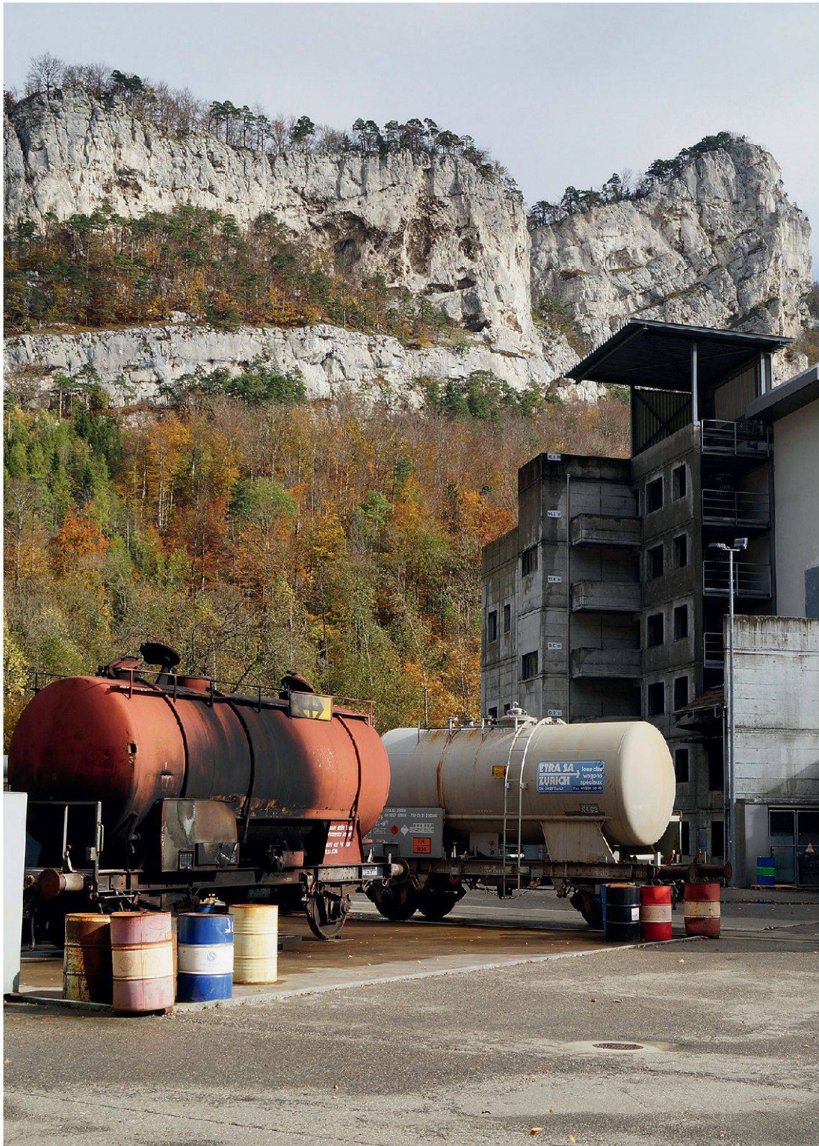
Abbildung 4: Brandplatz mit mehrstöckigem Übungsgebäude und Güterwagen mit Gefahrgütern. Die Brandspuren an Gebäude und Güterwagen illustrieren die Übungstätigkeiten auf dem ifa-Gelände in der Klus.