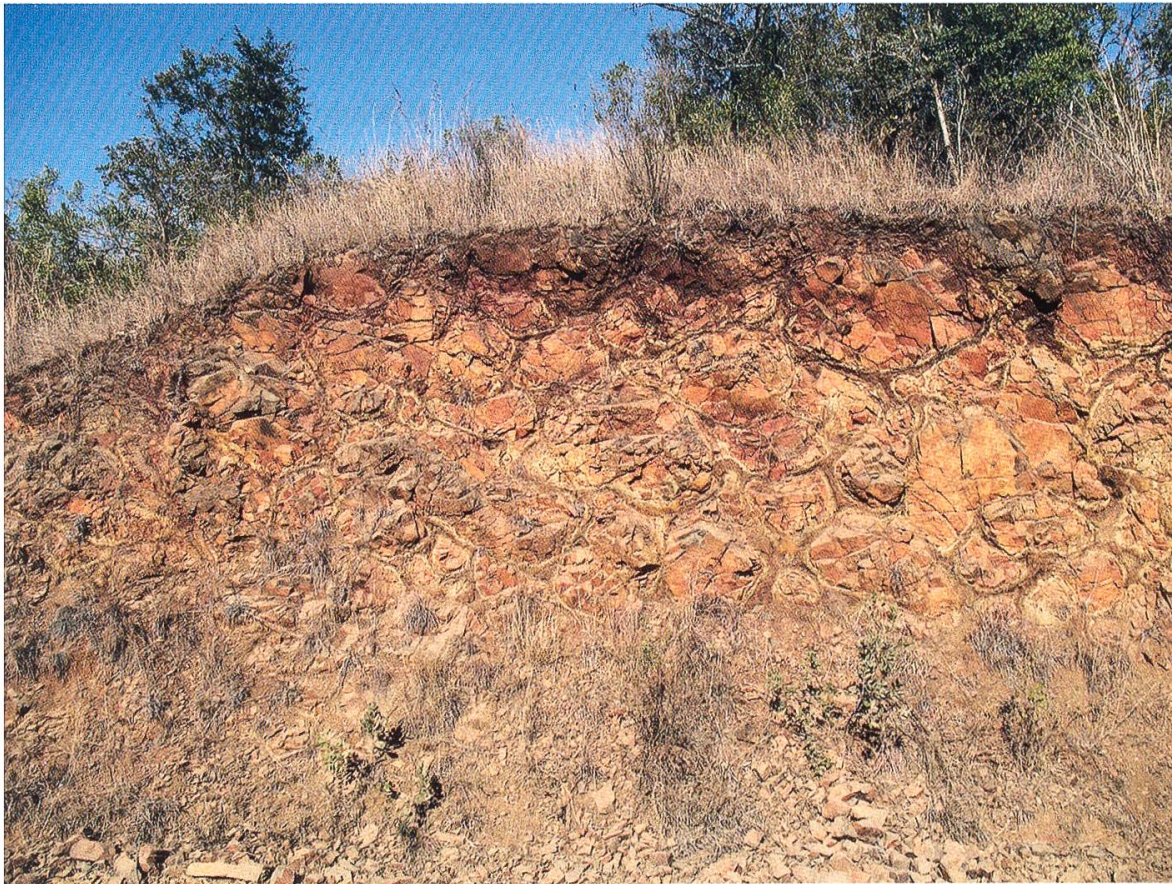
Abbildung 1: ca. 3,4 Milliarden Jahre alte Kissenlava (Pillow Basalt), Barberton-Grünsteingürtel (Südafrika). Rot gefärbt durch Verwitterung. Kissenlava entsteht subaquatisch durch schnelle Abkühlung der Oberflächen der noch fliessenden Lava (siehe Abbildung 2). Kissenlaven gelten daher als sicheres Indiz für subaquatischen Vulkanismus, und somit für Wasser.

Soweit wäre dann ja schon alles fast «wie heute», d.h. Temperaturen im Bereich, in dem flüssiges Wasser vorkommt. Die Sache hat aber einen entscheidenden