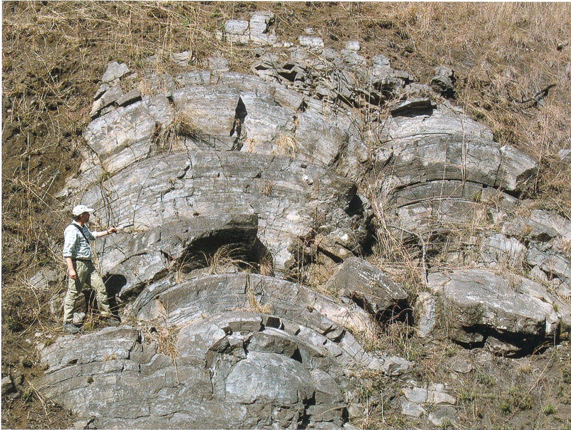
Abbildung 3: 2,6 Milliarden Jahre alte «Giant Stromatolites» in Dolomiten der Malmani Gruppe, Transvaal Supergruppe, Sdafrika. Stromatolithe sind biogene Gebilde, die (auch heute noch) durch das Wachstum von Mikrobenmatten entstehen. Bei der Bildung dieser aussergewhnlich grossen Stromatolithe waren schon Cyanobakterien beteiligt, d.h., sie stellen einen Beleg fr Photosynthese vor 2,6 Milliarden Jahren dar.

Versptung nach dem Auftreten der Cyanobakterien. Der Hauptgrund drfte in den reduzierenden Umgebungsbedingungen liegen. Vor allem im Ozean gelstes zweiwertiges Eisen ( \text{Fe}^{2+} ) wurde zu schwer lslichem dreiwertigem ( \text{Fe}^{3+} ) aufoxidiert und bildete grosse Lagesttten von Eisenoxid in den sogenannten «Banded Iron Formations». Die Redoxbedingungen im Ozean haben so noch eine ganze Weile den durch die Photosynthese freiwerdenden Sauerstoff im Ozeanwasser wieder aufgebraucht.