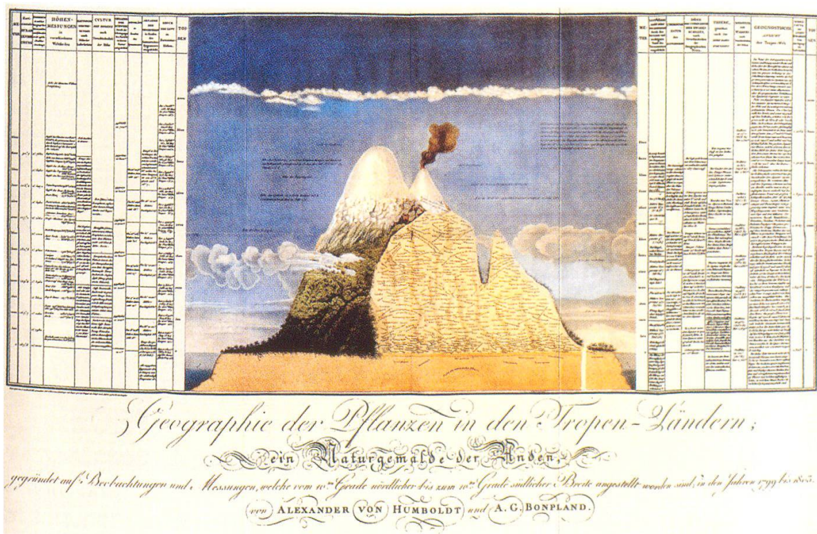
Abbildung 1: «Geographie der Pflanzen in den Tropen-Ländern; ein Naturgemälde der Anden». Beilage zu Alexander von Humboldt und Aimé Bonpland, Ideen zu einer Geographie der Pflanzen nebst einem Naturgemälde der Tropenländer, Tübingen 1807.

An dieser Stelle wollen wir nur den letzten Punkt illustrieren. Man nimmt an, dass Humboldt Anregungen für die Darstellungsweise während seiner Zeit im preussischen Montanwesen von den dort üblichen Bergwerksaufzissen erhalten hatte. In Profilform zeichnete er in der Folge nicht nur einzelne Berge, Gebirgszüge oder