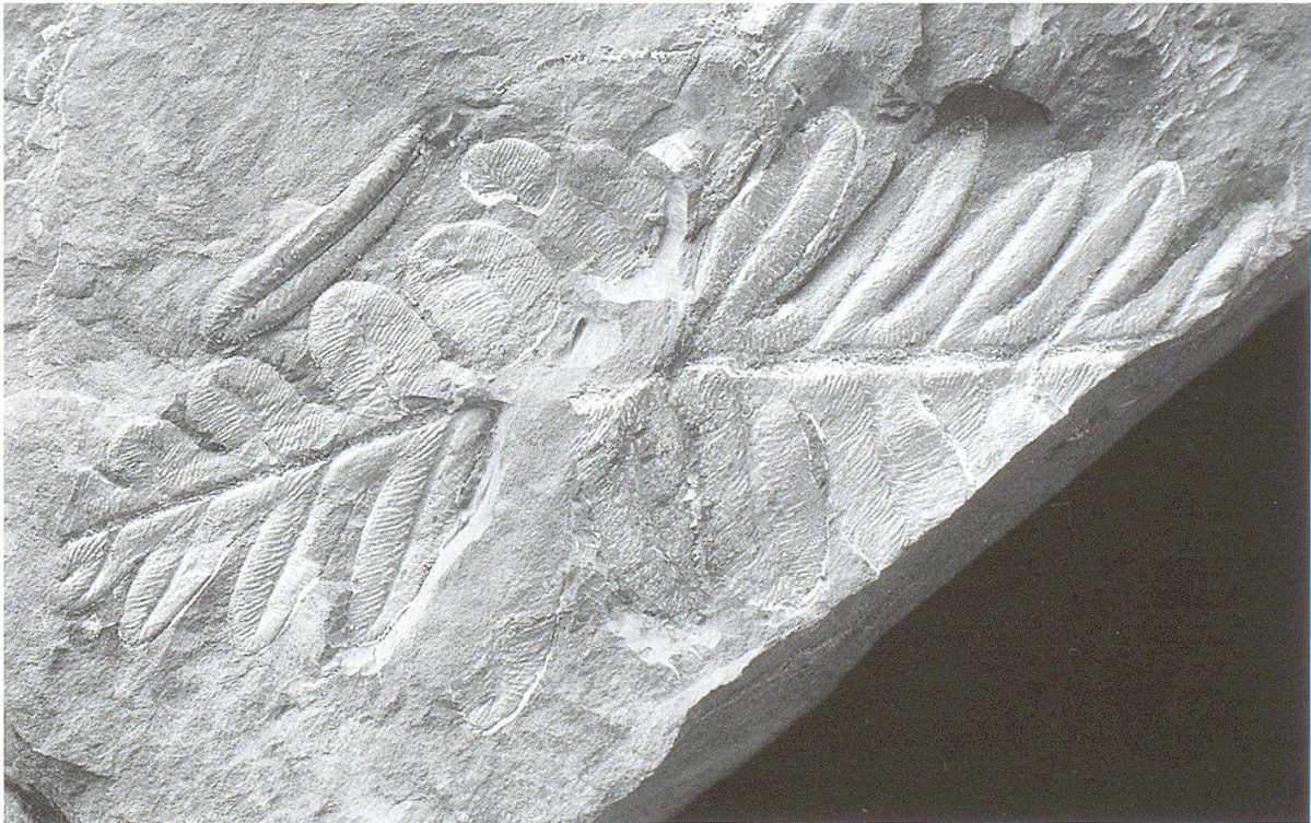
Abbildung 33: Alethopteris zeilleri (NMBE D 2963), «Samenfarn».