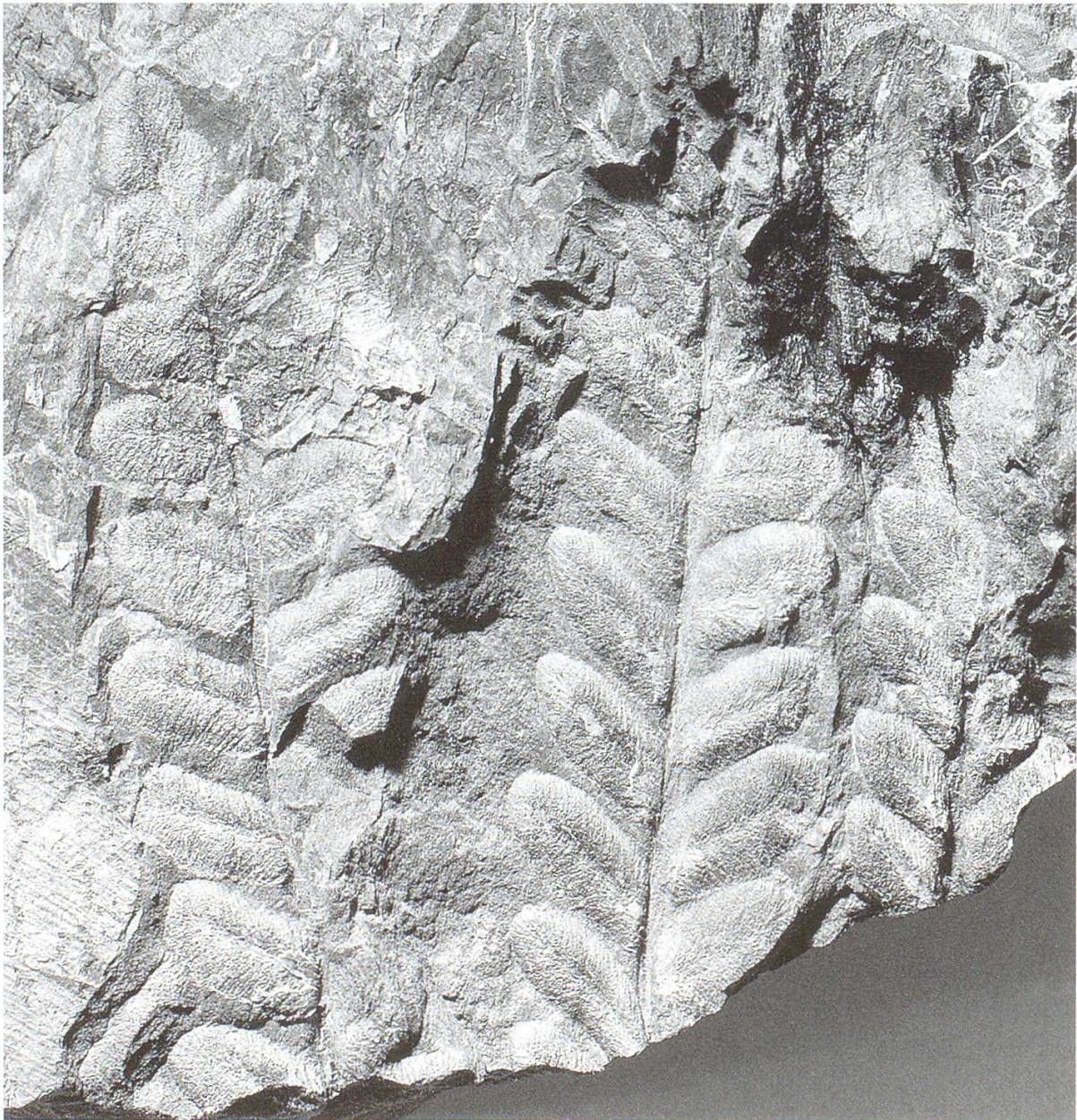
Abbildung 32: Pecopteris polymorpha (NMBE D 3101), Farn.

ordnung. Auch das Vorhandensein von Alethopteris zeileri (Abb. 33) und Anularia stellata sowie Sphenophyllum oblongifolium (Abb. 34) passt zu dieser Interpretation. Pecopteris arborescens ist durch die ganze Lötschberg-Serie gleich häufig vertreten. Dies deutet an, dass der obere Teil des Forézien hier nicht mehr vorkommt oder nicht beprobt worden ist.