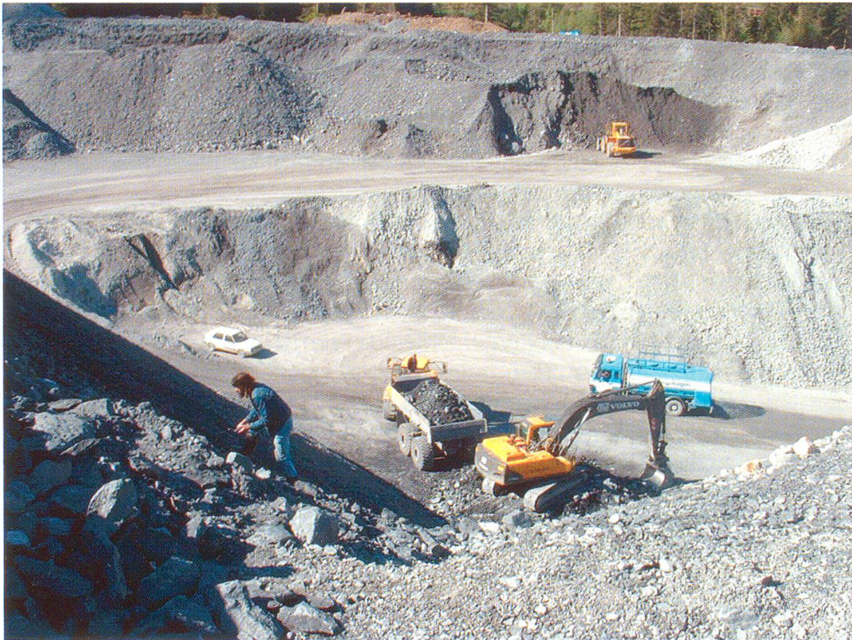
Abbildung 30: Ausdauer und Geduld waren bei der Fossilsuche gefragt.

Ausbeute, mehr als 600 Proben, zeigt eine vielfältige Flora des Oberkarbons (Abb. 31). Die fossilen Pflanzen stellen sicherlich die bedeutendsten Funde dar, welche während des Baus des Lötschberg-Basistunnels auf Berner Boden gemacht wurden. Diese Funde sollen deshalb auch im Mittelpunkt dieses Berichtes stehen.