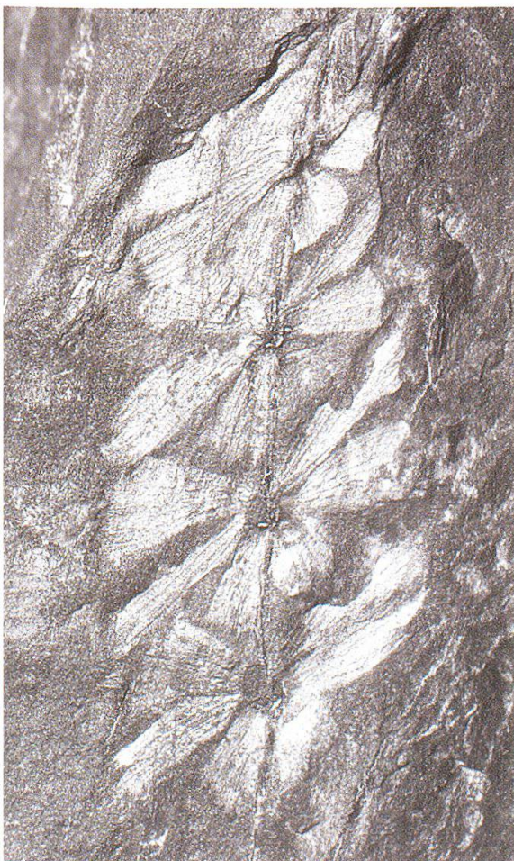
Abbildung 34: Sphenophyllum oblongifolium (NMBE D 3181), «Schachtelhalm».