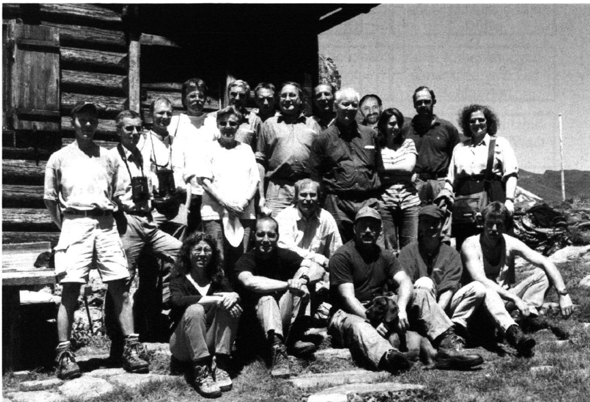
Abbildung 29: Team des Naturschutzinspektorates.