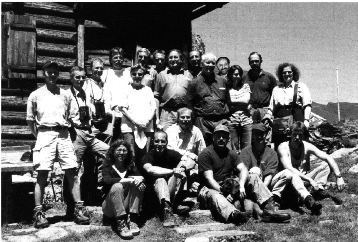
Abbildung 29: Team des Naturschutzinspektorates.