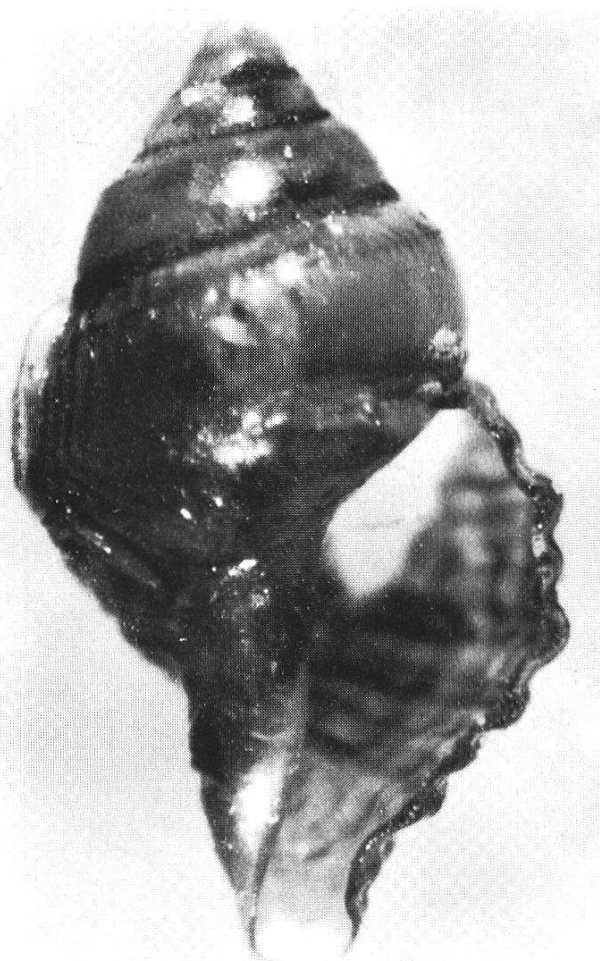
Fig. 1 Spécimen, vue orale. Hauteur du spécimen 2 mm.

Sinusigera d'Orb. a parfois été considéré comme étant l'adulte d'un genre, voire d'une classe particulière de gastéropodes pélagiques. Ainsi CRAVEN (1877): «Je crois d'ailleurs que jamais l'on n'a recueilli d'individus de Sinusigera qui montrassent un passage du soi-disant état embryonnaire à une forme plus adulte. Personnellement je n'ai jamais rien observé qui pût faire croire à l'existence de tels