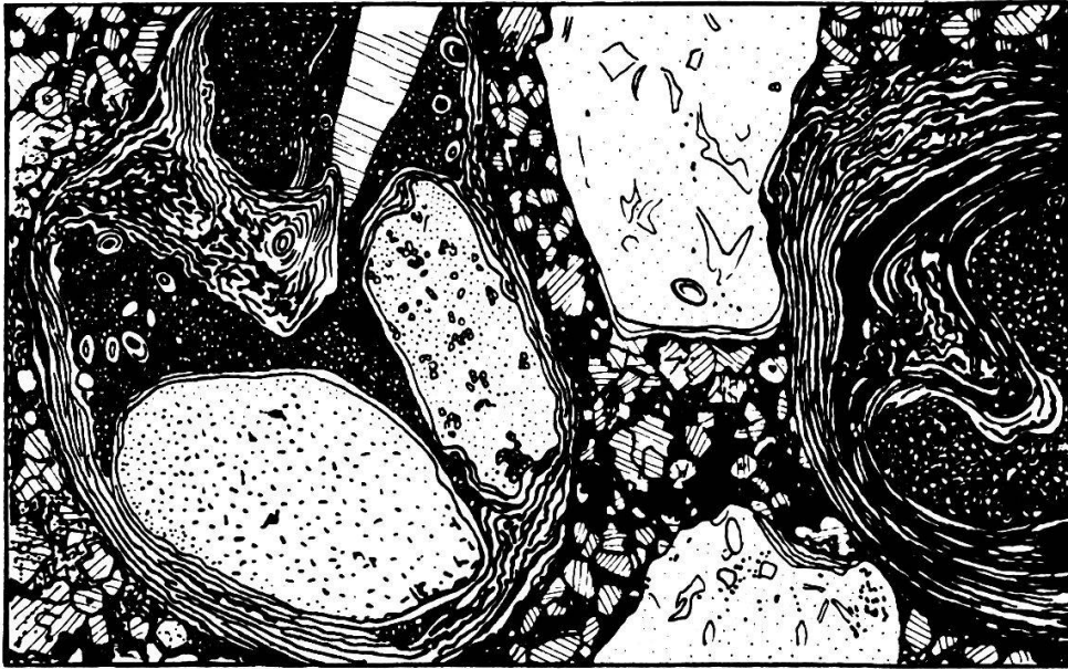
Fig. 12. Macro-Oolith, Bajocien, Gitzifurgge, Dünnschliff. Vergr. ca. 8×

Mächtigkeit in der tiefsten Falte nahezu konstant. An der Gitzifurgge führt die Echinodermenbreccie Schichten, die sich aus gut erhaltenen Crinoidenstielgliedern und Seeigelstacheln aufbauen. In ihrer ganzen Ausdehnung enthält sie Horizonte mit angebohrten Geröllen von Triasdolomit und Quartenschiefern. Ein Maximum hinsichtlich Grösse und Menge besitzen diese im Profil der Gitzifurgge. Nach NW und S werden die Gerölle von hier aus spärlicher und kleiner. Am raschesten nehmen sie in südlicher Richtung ab, am kontinuierlichsten halten sie sich gegen Westen.