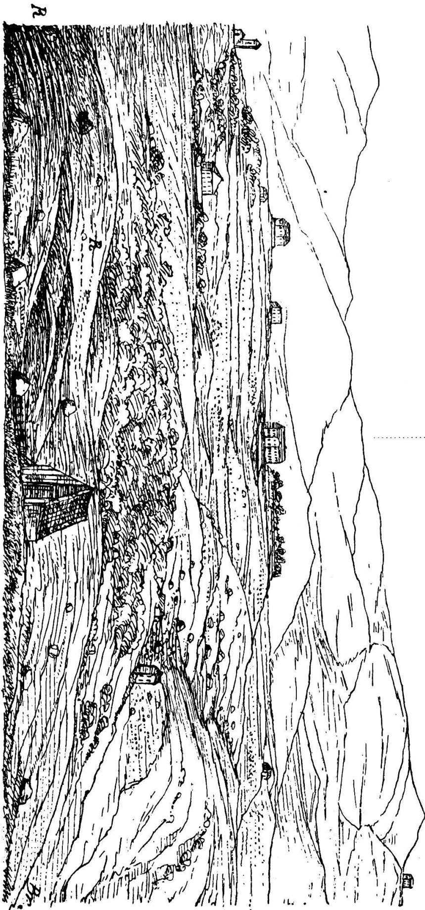
Bergmoränenlandschaft bei Albergo alpino. — R = Rundhöcker.