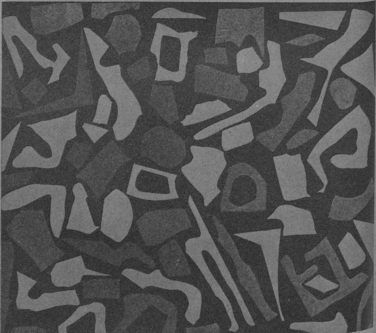
Testpräparat für statistische Untersuchungen