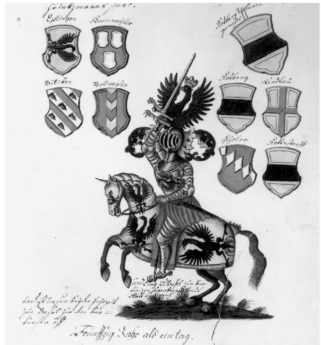
4: Turnierritter aus der Familie der Herren von Eptingen, umgeben von den Wappen der Vorfahren. Kopie des 17. Jh. nach einer verlorenen, spätmittelalterlichen Vorlage.

Hinter den vielseitigen Bemühungen Rudolfs von Habsburg, die Herrschaft über Basel zu gewinnen, stand das