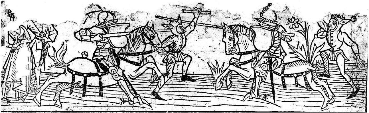
5: Spätmittelalterliche Tjost auf einem Kalenderblatt, um 1480. Zu beachten sind die fastnächtlisch als Narren mit Eselsohren verkleideten Turnierhelfer.

gesinnter Herren und zur Flucht Leopolds über den Rhein führte. Basel geriet nach diesen Ereignissen auf Betreiben Leopolds in politische Bedrängnis, vorübergehend sogar in die Reichsacht. Gewiss darf die «böse Fastnacht» nicht als Aufstand des Stadtbürgertums gegen die Vorherrschaft des Adels gedeutet werden, wie das in der älteren Literatur versucht wird. Es handelte sich vielmehr um einen Konflikt zwischen Parteien, die ihre Anhänger in allen Bevölkerungsschichten hatten. Auch wenn die Turnierfeste selbst dem Adel vorbehalten blieben, lebten in der Stadt doch zahlreiche zünftische Gewerbe von der Repräsentationskultur des Rittertums und von den an den Turnieren unverzichtbaren Dienstleistungen, man denke nur an die Berufe der Huf- und Waffenschmiede, Sporer, Sattler, Bader, Bäcker, Metzger oder Gastwirte. Nicht ausser Acht zu lassen ist die Unentbehrlichkeit der Randgruppen, der Juden wegen der Aufnahme von Krediten, der Gaukler, Musikanten und Prostituierten mit ihrem Unterhaltungsangebot.