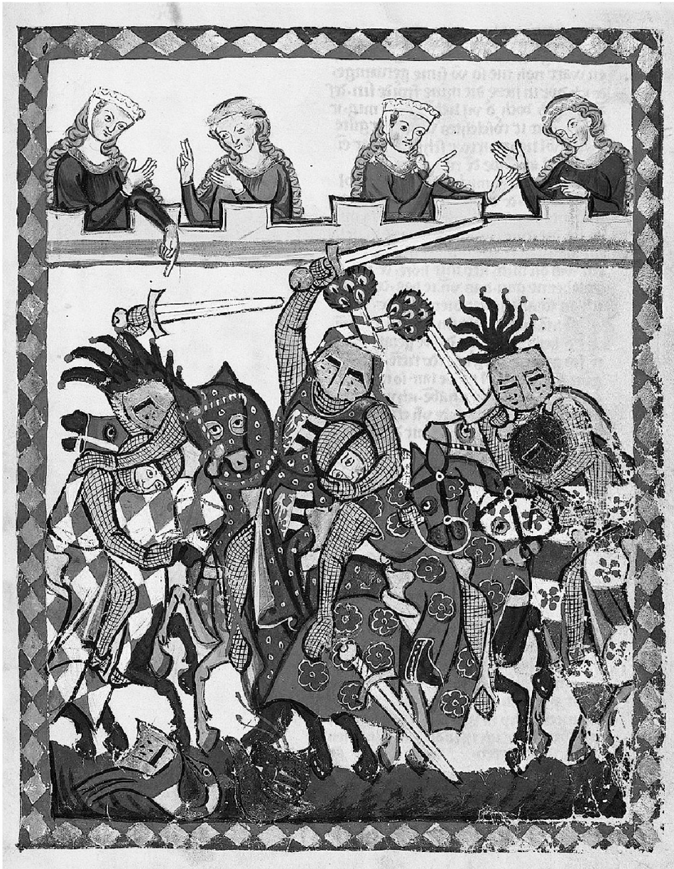
1: Turnei, Herzog von Anhalt in der Manessischen Liederhandschrift, frühes 14. Jh.

Ein besonders aufschlussreiches Fundstück liegt von der ebenfalls im Erdbeben von 1356 zerstörten Burg Madeln bei Pratteln vor. Es handelt sich um einen Topfhelm aus der Zeit um 1300, der auf der linken Schläfenpartie die drei Einstichlöcher eines Turnierkrönleins zeigt. Schliesslich sind unter den Bodenfunden auch reliefverzierte Ofenkacheln des 14. und 15. Jh. zu erwähnen, die nebst vielen anderen Motiven auch turnierende Ritter zeigen. Alles in allem sind aber die Bildbelege und die archäologischen Funde zu spärlich, als dass sich aus ihnen ein zusammenhängendes Bild des Basler Turnierwesens re-