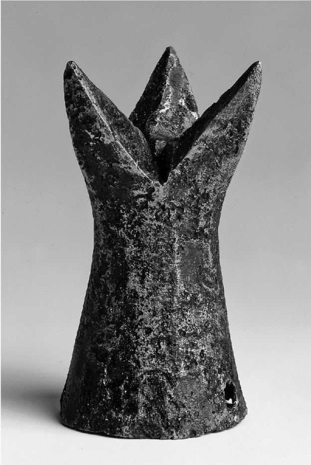
3: Turnierkrönlein, gefunden auf der 1356 im Basler Erdbeben zerstörten Burg Waldeck im Leimental.

nügend Raum für Abschränkungen und die Tribünen, von denen aus eine starke Gästeschar, auch die vornehme Damenwelt, den Turnirkämpfen zuschaute. Zudem erhob sich direkt am Rande des Münsterplatzes das Haus zur Mücke, wo sich die Begleitveranstaltungen der Turnierfeste, die Bankette, Trinkgelage und Tanzvergügungen, abspielten. Bei den Turniereinrichtungen, den Tribünen, Planken und Schranken, handelte es sich nicht um feste Bauten, sondern um provisorische Holzkonstruktionen, die für jeden Anlass neu errichtet und nach dessen Abschluss wieder abgebrochen wurden. Am Pfingst- und Hochzeitsturnier von 1315 ereignete sich ausser einem tödlichen Zusammenstoss zweier Turnierer ein ärgerlicher Zwischenfall, indem eine Tribüne einstürzte. Es gab zahlreiche Verletzte, auch wurden im allgemeinen Durcheinander viele Wertsachen entwendet.