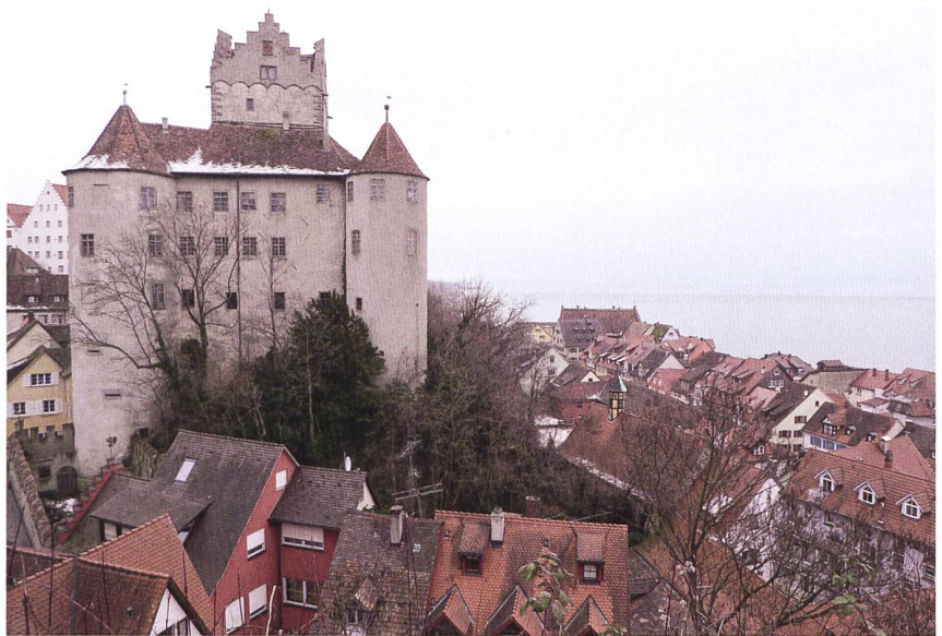
Schloss Meersburg, Residenz der Fürstbischöfe von Konstanz.