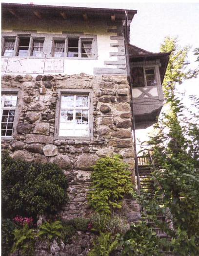
Schloss Wellenberg, Seitenfassade.