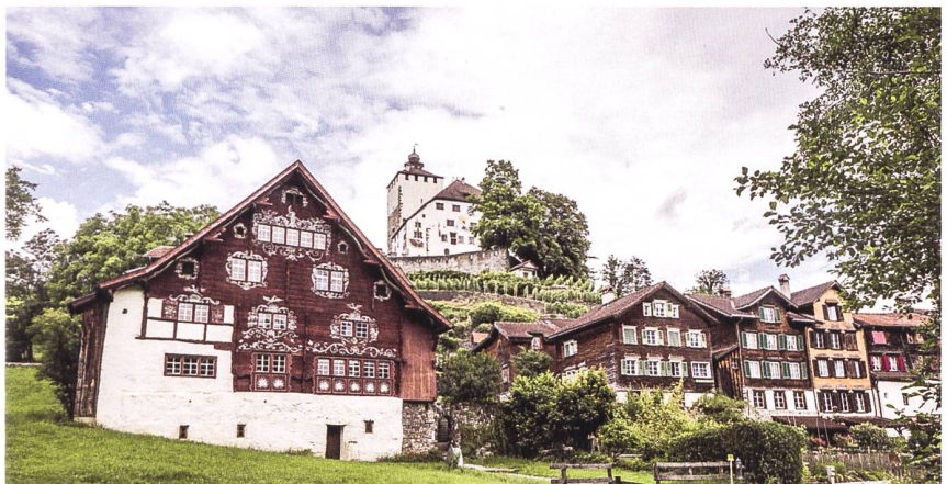
Städtchen und Schloss Werdenberg.

Bei Interesse ist eine Voranmeldung per E-Mail ( info@burgenverein.ch ) erwünscht.