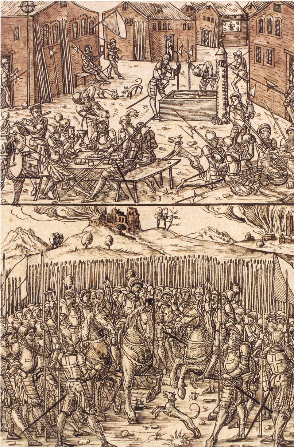
1: Der Kriegsdienst wird zum Kriegshandwerk. Illustration in der Silberysen-Chronik von 1576. Aarau, Aargauer Kantonsbibliothek, MsWettF 16: 1, p. 927: Christoph Silberysen, Chronicon Helvetiae, Teil I (1576) ( https://www.e-codices.ch/de/list/one/kba/0016-1 )

sind Schweizer Truppen in holländischen, bis 1830 in französischen Diensten anzutreffen. Nachdem 300 Schweizer Söldner in der Juli-Revolution 1830 umgekommen waren, beendigte die Tagsatzung die