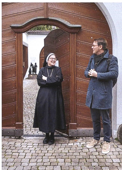
Vor dem Kloster St. Andreas.