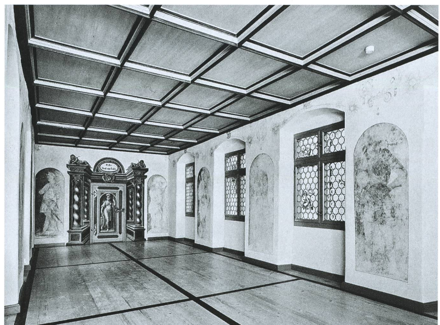
Schwandegg. Kaisersaal.

spannenden spätgotischen Ausmalung erwartet. Kurzer Aufstieg zum Schloss Schwandegg, einer stark verbauten mittelalterlichen Adelsburg, die später als privater Landsitz diente. Seit 1974 im Besitz des Kantons Zürich, beherbergt Schwandegg ein Restaurant. Im Anbau einzigartiger, reich ausgemalter Festsaal aus dem 17. Jh., der auf einen Allgäuer Kaufmann zurückgeht. Zum Abschluss Apéro im Schlosshof und Rückfahrt nach Winterthur.