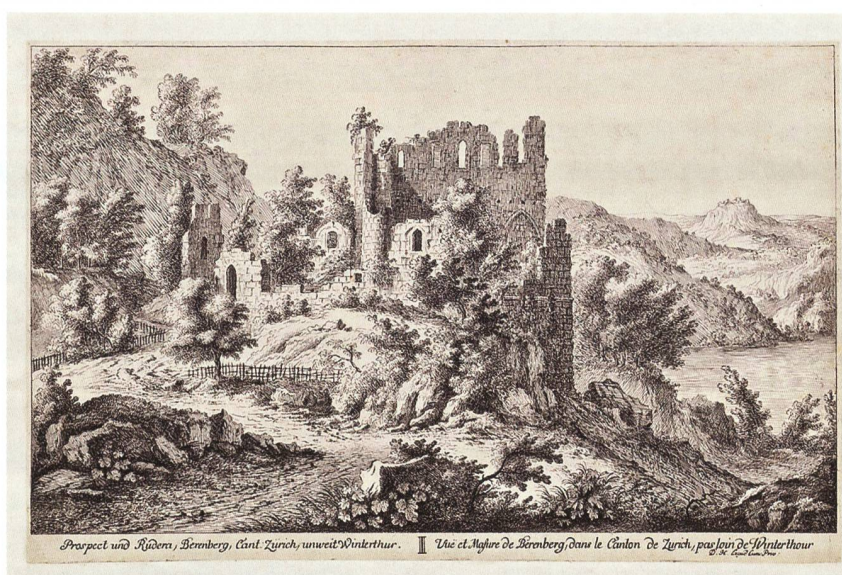
Beerenberg. Stich von Herrliberger, nach einer Vorlage um 1700 (ZB Zürich).