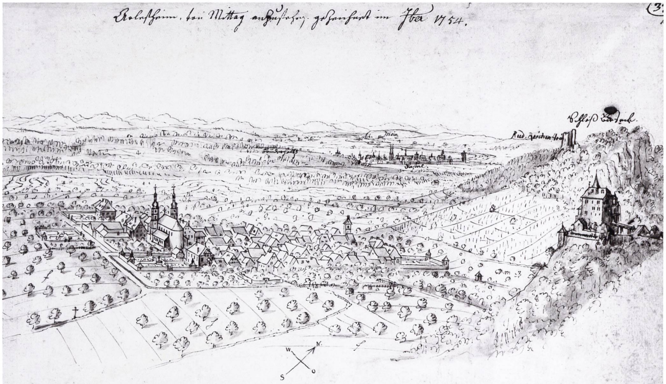
5: Ansicht von Arlesheim BL von E. Büchel um 1750. Eine der vielen detailgetreuen Dorfansichten der Basler Landschaft, die der Basel Konditor, Kartograph und Maler gezeichnet hat.

tung erfasst nun auch diese Gebäude oder Baugruppen mit voller Wucht.