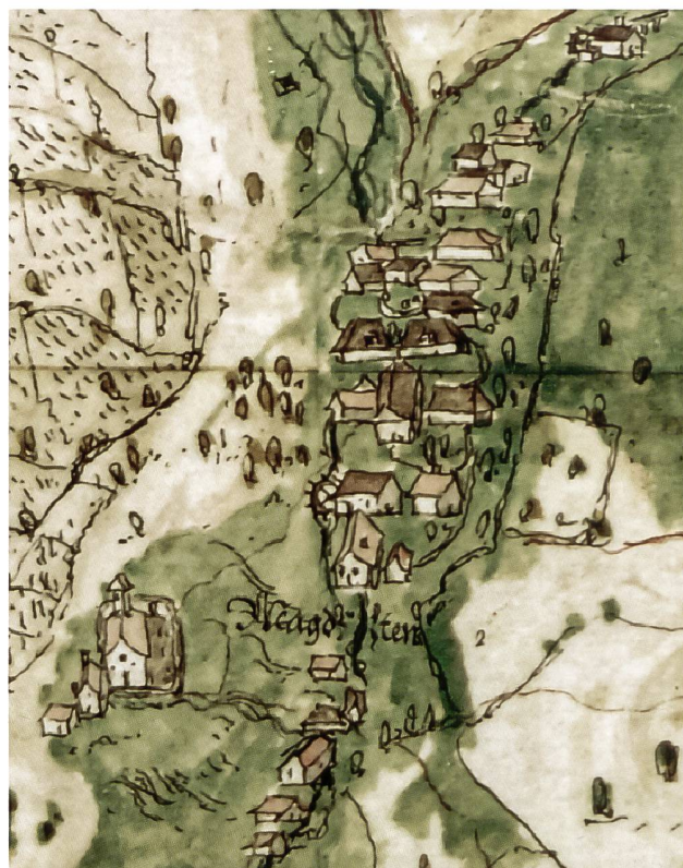
4: Ein Blick über die Grenze der einstigen Basler Landschaft auf das Dorf Magden AG von M.H. Graber von Zisserthal 1602–1604. Deutlich erkennbar sind die Holzständerbauten (mit Walmdach) sowie die Steinbauten (mit Satteldach). Ausschnitt aus der Karte Grenzverlauf zwischen Basler und Österreichischer Herrschaft.

Seit nunmehr etwa 50 Jahren wird in der Schweiz auf professioneller Basis bauarchäologische Forschung betrieben. Ihre Ursprünge liegen meistens in der Baukonjunktur der 1960er-Jahre und den damit verbundenen rigorosen Eingriffen in die Siedlungskerne. Um diesen Umwandlungsprozess besser steuern und wichtige Bau-