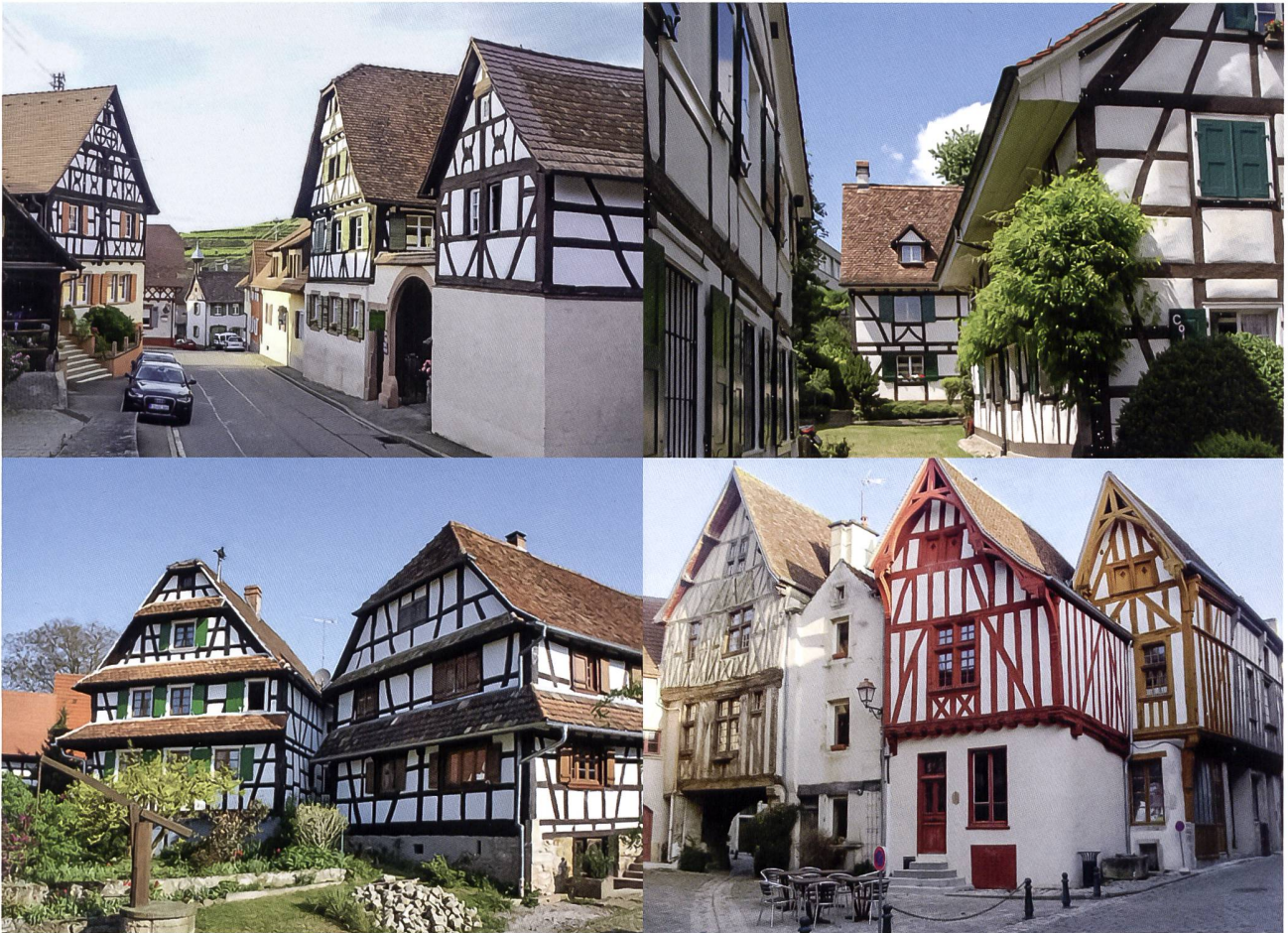
7: Welches ist das Baselbieter Dorf? Vier verschiedene Kulturregionen – aber die gleichen Bautypen: Markgräflerland/ Kaiserstuhl und Allschwil BL (oben), Elsass und Burgund (unten).

rascht hat, bezeugt Hauptstrasse 25 eindrücklich, dass bereits im 15. Jh. mit entsprechend grossen Bauernhäusern zu rechnen ist, wie sie aus jüngerer Zeit bekannt sind. Sie folgen dem nach wie vor gültigen Grundsatz von Richard Weiss, dass Bauernhäuser ein Abbild des Klimas und der Rohstoffe sind, die ihnen ihre Standortumgebung bietet 17 (Abb. 6).