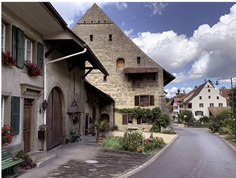
2: Steinhäuser in Oltingen BL mit dem imposanten «Gross Huus» aus Tuffsteinmauerwerk, dem bislang ältesten bekannten ländlichen spätgotischen Steinbau der Nordwestschweiz (1513/14 (d)).

etwa zum baukulturellen Erbe oder zur Siedlungsgenese zu verfassen. Klassiker sind auch die vielen landauf und landab gefeierten Dorfjubiläen, die praktisch immer auf der schriftlichen Ersterwähnung des Dorfnamens, kaum je aber auf dem ersten archäologischen Nachweis der Siedlung fussen. Auch hier leisten Freiwillige wichtige Identifikationsarbeit für das Gemeinwesen, während die Wissenschaft diese zentralen Vermittlungsplattformen zu wenig wahrnimmt.