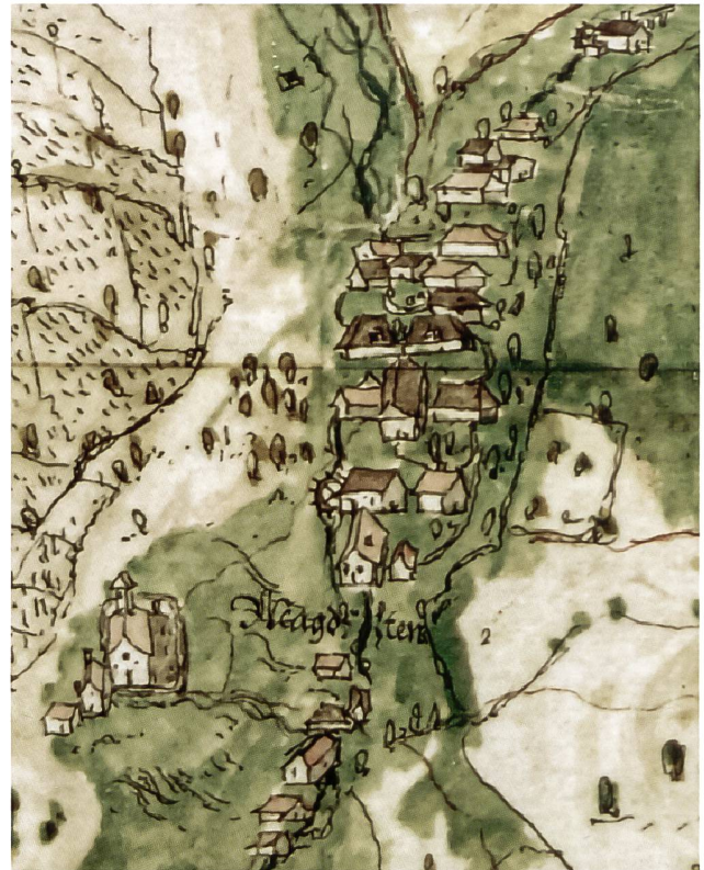
4: Ein Blick über die Grenze der einstigen Basler Landschaft auf das Dorf Magden AG von M.H. Graber von Zisserthal 1602–1604. Deutlich erkennbar sind die Holzständerbauten (mit Walmdach) sowie die Steinbauten (mit Satteldach). Ausschnitt aus der Karte Grenzverlauf zwischen Basler und Österreichischer Herrschaft.

Seit nunmehr etwa 50 Jahren wird in der Schweiz auf professioneller Basis bauarchäologische Forschung betrieben. Ihre Ursprünge liegen meistens in der Baukonjunktur der 1960er-Jahre und den damit verbundenen rigorosen Eingriffen in die Siedlungskerne. Um diesen Umwandlungsprozess besser steuern und wichtige Bau-