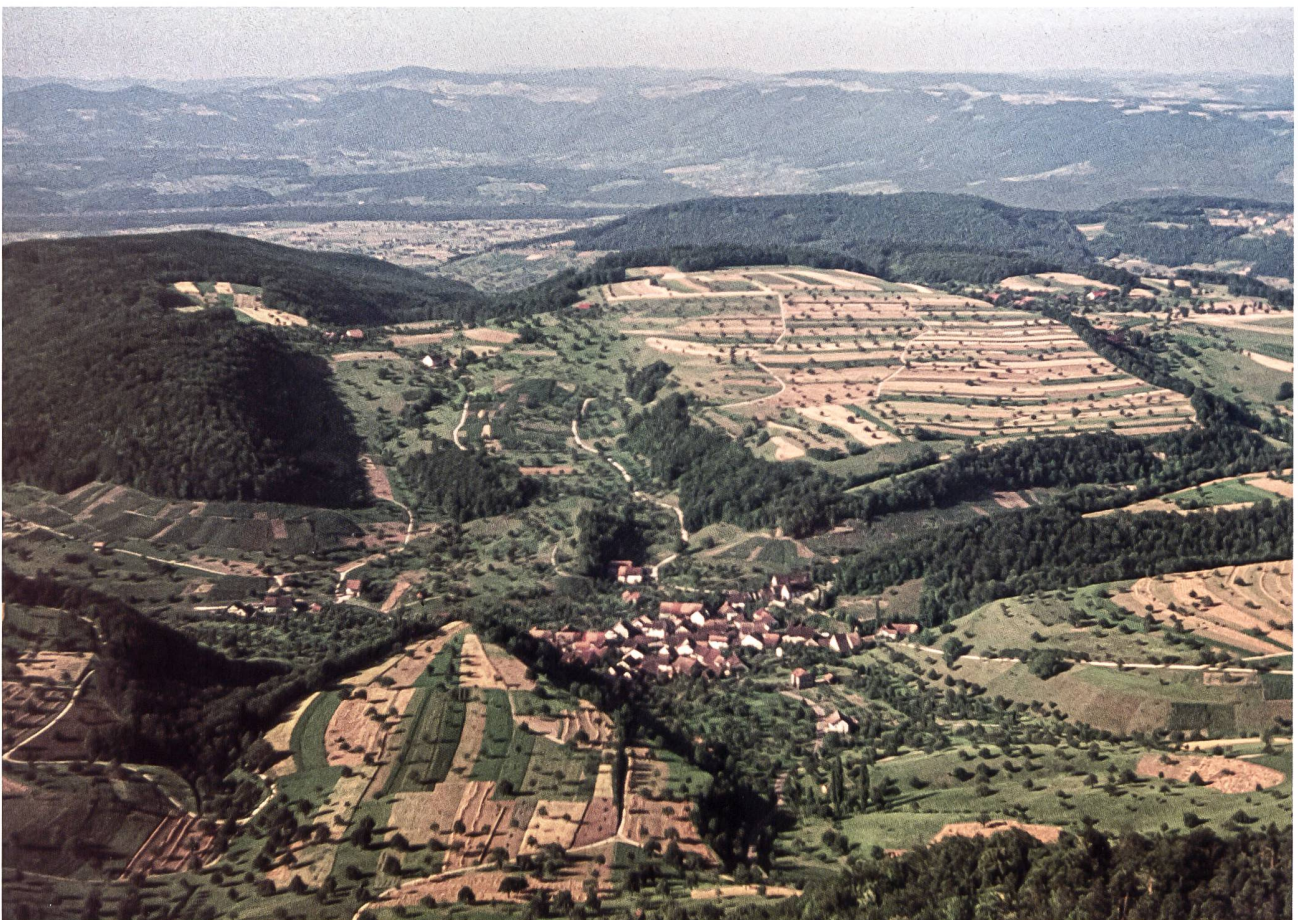
1: Das Dorf Buus BL im Jahre 1943. Das Haufendorf liegt eingebettet in seiner noch intakten Kulturlandschaft, aus der es sich nach allen Richtungen nährt.

und umfassend Städte, Klöster, Kirchen oder Burgen zum Gegenstand ihrer Forschungen gemacht haben, sind integrale Untersuchungen zu einem Dorf in seiner zeitlichen und räumlichen Gesamtheit in der Regel ausgeblieben. 3 Zumeist wurde und wird die Aufarbeitung der Vergangenheit der Dörfer den sogenannten Dorfhistorikern – früher dem örtlichen Pfarrer oder Lehrer – und somit immer engagierten und vielfach durchaus fachkundigen Laien überlassen. Sie leisten diese verdienstvolle Aufgabe mit viel Einsatz und Leidenschaft und zumeist auf ehrenamtlicher Basis. Nur nach Möglichkeit aber übernimmt eine kantonale Fachstelle oder eine Universität in diesen «Dorfchroniken» oder «Heimatkunden» die Aufgabe, wichtige Kapitel wie