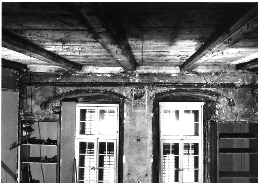
6: Thun, Schloss. Mittlerer Abschnitt des südlichen Schlosstrakts, kleiner Saal im ersten Obergeschoss des Kernbaus. Die Decke dürfte etwa zeitlich parallel zum Dachstuhl um 1566/67 entstanden sein. Die spätbarocke Grisaille-Malerei von 1700 an der Südwand deutet die ehemalige Fenstergliederung an. Blick nach Südwesten.

bild vielleicht suggerieren mag. Entstanden ist er vielmehr wahrscheinlich aus einem kleineren Kernbau im mittleren Abschnitt. Älteres Mauerwerk unter dem Erdgeschossboden könnte auf einen mittelalterlichen Steinbau hinweisen. Dieser mag als Palas oder Wohnbau zu deuten sein.