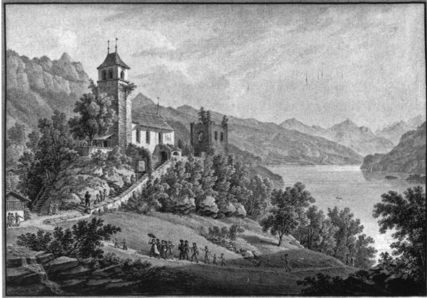
1: Die Burg mit der Kirche von Westen. Aquarell Gabriel Lory, père, um 1828.