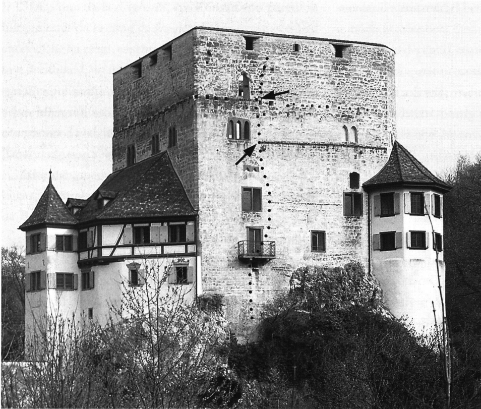
1: Duggingen, Ruine Angenstein von Süden. Gepunktet die Abbruchlinie der im Basler Erdbeben von 1356 eingestürzten Partie.

nellen Ereignisgeschichte hin zur Kulturgeschichte. V.a. im Gebiet der Mittelalterarchäologie eröffnete sich ein weites Feld zur Erforschung der nichtschriftlichen Geschichte, der Lebensgewohnheiten, der sozialen Schichtungen, der Alltagsgeschichte. Die neuen Ziele hiessen: Hirsebrei und Hellebarde; Küche, Kemenate oder Bettelmönch! Die Forschung wendet sich ab von der «schriftwürdigen» Gesellschaft – hin zum einfachen Hirten und Handwerker.