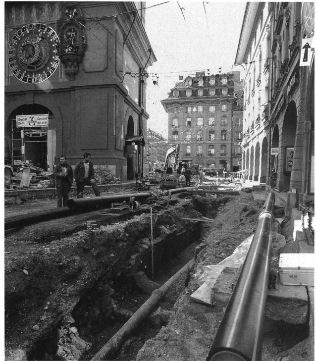
2: Bern, Zeitglockenturm. Archäologischer Befund des Stadtbrandes von 1405.

Viele Beispiele von ebenso berühmten Naturkatastrophen ermangeln gegenwärtig noch konkreter archäologischer Befunde, so der Seesturz von Zug, der am 4. März 1435 26 Häuser und 60 Menschen im Zugersee versinken liess. Oder es wäre zu nennen der Bergsturz von Plurs im