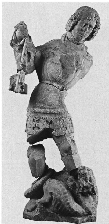
3: Bern, Skulpturenfund der Münsterplattform. Im Bildersturm von 1528 zerstörte, in Portionen zerteilte Figur des hl. Georg. Gesicht zerhackt.

auch ungefähr die Ausdehnung der bei heftigem Nordostwind wütenden Katastrophe. 8 Im Anschluss an die Katastrophe wurde der wegen Stadterweiterungen bereits innerstädtisch gelegene Stadtgraben verfüllt. 1000 Freiwillige sollen Brandabraum in diese Lücke gekarrt haben. So fanden wir denn im fraglichen Bereich massenweise Brandschutt. Um den Graben besser erreichen zu können, wurde nördlich neben dem Zeitglockenturm ein Haus abgebrochen, obschon es lediglich ausgebrannt war (Abb. 2). Die Lücke besteht bis heute. Im Befund fanden wir die entsprechenden Belege: die Brandrötungen in situ und die Brandschicht, direkt darüber die Abbruchschichten. Der Bezug ist für diesmal eindeutig.