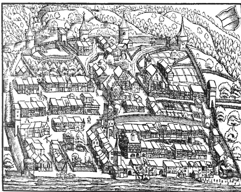
13: Die älteste Zuger Stadtansicht aus der Chronik des Johannes Stumpf, Zürich 1547. Die Vorlage für den Holzschnitt stammt vermutlich vom Zürcher Zeichner Hans Asper. Original 13,2 × 17 cm.

In der ersten Hälfte des 13. Jahrhunderts – jedenfalls vor der Erwähnung Zugs als oppidum 1242 – wurde eine Ringmauer für die Stadt am See errichtet. Die ursprüngliche Stadtbefestigung war nicht viel mehr als eine im Grundriss bogenförmige Mauer mit einem streckenweise verlaufenden Graben und ohne Türme. Wahrscheinlich wurde schon bald die 1266 erwähnte Liebfrauenkapelle im Süden der Stadt innen an die Ringmauer gebaut. Die Disposition des Grundrisses mit fünf (heute vier) parallel zum Seeufer verlaufenden Häuserzeilen, zwei Gassen, zwei Ehgräben und einem Uferweg (mit Ufermauer?) dürfte aus der Gründungszeit stammen. Im aufgehenden Bestand haben sich diverse Steinbauten und Teile von Ständerbauten des 14. Jahrhunderts erhalten. Im Verlauf des 13. und 14. Jahrhunderts wurde – wahrscheinlich unter habsburgischer Herrschaft – die Stadtbefestigung schrittweise ausgebaut: Das Haupttor wurde mit dem «Zytturm» und seitlichen Bastionen verstärkt, und um die ältere Ringmauer wurde im Abstand von knapp 20 m eine zweite Wehrmauer errichtet, die gleichsam einen Zwinger bildete, der dem Verlauf der heutigen Grabenstrasse entspricht.