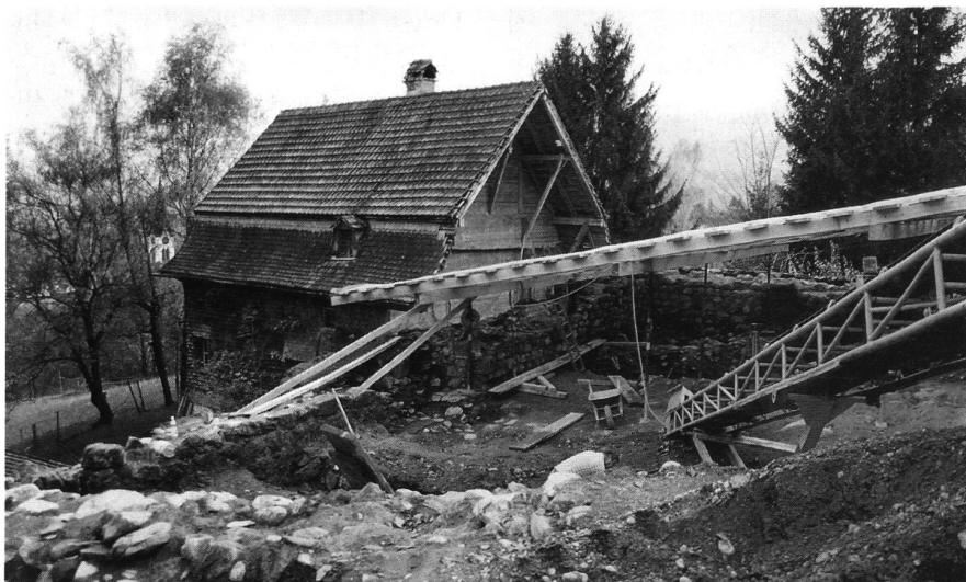
8: Ausgrabungsareal 1999 auf der Burgruine Gams (Gams SG).

Ein Nationalfondsprojekt des Kantons Appenzell Innerrhoden im Zusammenhang mit dem 600. Jahrestag der Schlacht am Stoos im Jahre 2005 soll mit der Bearbeitung der Altfunde von der Burgruine Clanx sowie der Erforschung des Erdwerkes Schönenbüel (Bezirk Rüte AI) neue Ansätze für die «Siedlungszelle» Appenzell erbringen.