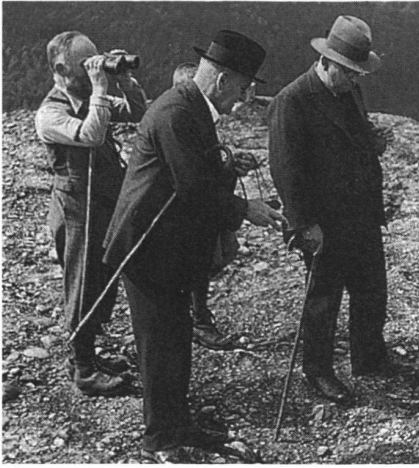
2: Dr. h.c. Gottlieb Felder (Mitte) 1936 bei der Besichtigung der Grabung auf Neu-Toggenburg (Oberhelfenschwil SG).

Vorstellungen der Ostschweizer Schulmethodik nannte 9 . Der Einfluss und die Tatkraft Felders, ganz im Stile des archäologischen «Patrons», sollten in der Ostschweiz in den folgenden Jahrzehnten eine rege Grabungs- und Sanierungstätigkeit auslösen. Ihm selbst wurde die liebevolle Anrede des «Burgenvaters» zuteil. G. Felder beschrieb den Umgang mit Burgen und Schlössern folgendermassen: «Wecken wollen wir die schlummernden nicht, jedenfalls nicht in dem Sinne, dass wir ans Wiederaufbauen gehen, wie man das andernorts tut, wo man über reiche Mittel zu verfügen hat, aber schützen und erhalten wollen wir die Ruinen als malerische Bereicherungen ihrer Landschaftsbilder und zur Nachdenklichkeit mahnende Zeugen verklungener Tage, Geschlechter und Lebensformen.» 10