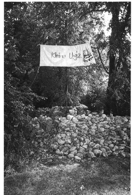
13: Densbüren, Ruine Urgiz. Den Kindern des benachbarten Bauernhofes ist auf «Kleinurgiz» ein Obolus zu entrichten.

möglich gewesen, die Ruine Urgiz zu sanieren. Die erfolgreiche Restaurierung Ruine Urgiz hat gezeigt, dass ein gezielter Einsatz von Arbeitslosen, ein Projekt finanziell entlasten kann. Allerdings gilt es jeweils abzuwägen, in welchen Fällen dies Sinn macht, denn eine Beschäftigung von Arbeitslosen bedeutet mehr Betreuungsarbeit für die Bauleitung und die Kantonsarchäologie.