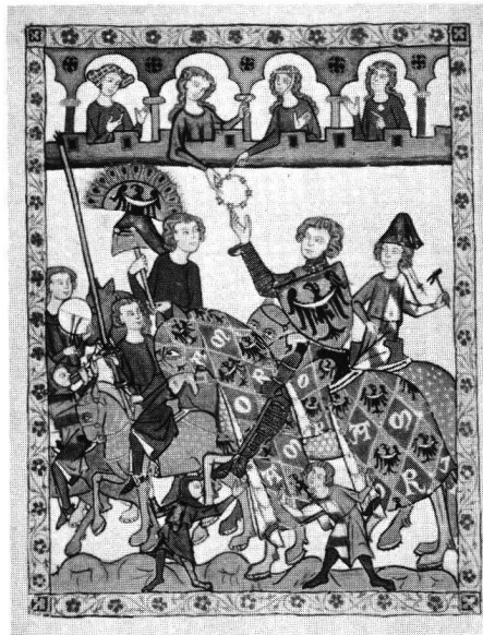
Auftritt zum Turnier. Manessische Liederhandschrift.

Turniere können der Obrigkeit allerdings auch Sorgen bereiten. Zum Ausnahmezustand eines mittelalterlichen Festes gehört die Gefahr, dass fröhliche Ausgelassenheit in blutigen Tumult umschlägt, dass aus dem Kampfspiel