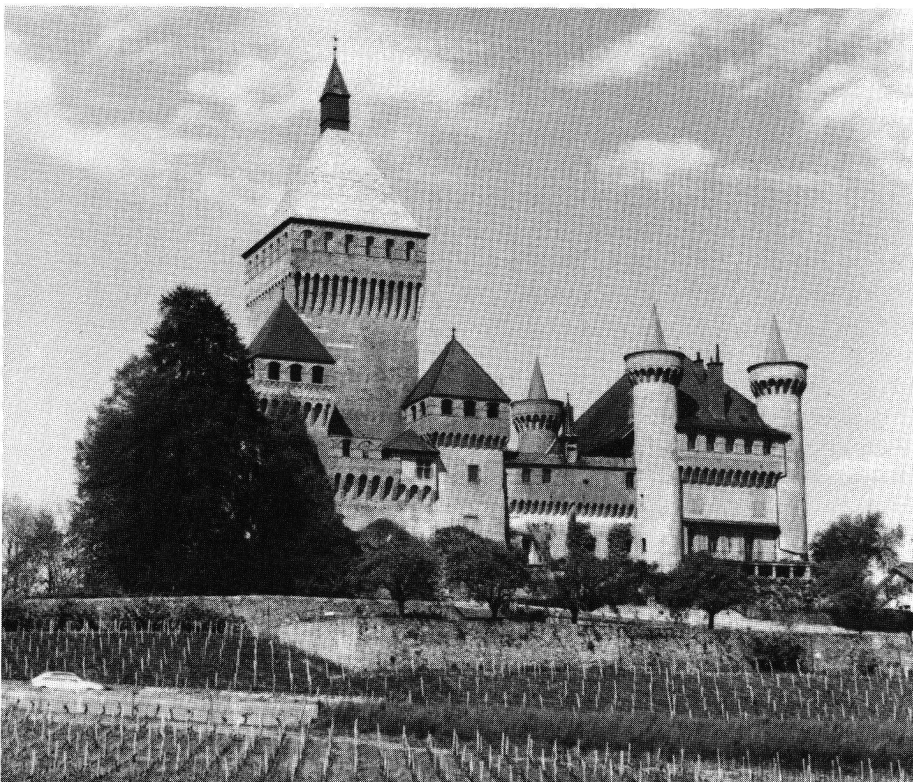
Vufflens, links der gewaltige, gegen 60 Meter hohe Donjon, rechts der geräumige Palas mit den vier runden Ecktürmen.

Schweizerischer Burgenverein, Balderngasse 9, 8001 Zürich, 01 221 39 47