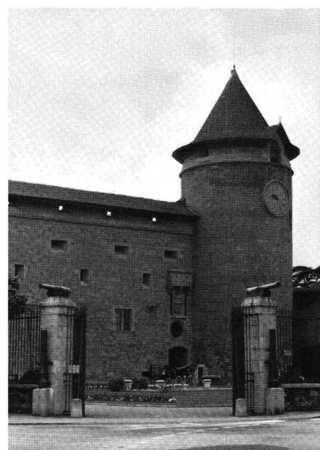
Morges, Donjon und Eingangspartie.