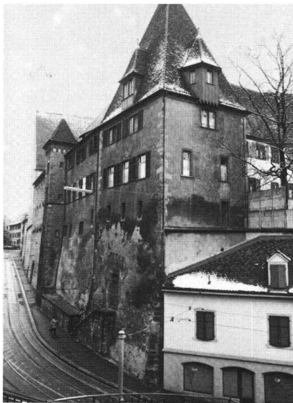
Der Basler Lohnhof vom Kohlenberg, dem ehemaligen Graben der inneren Stadtmauer, her gesehen. Im Hintergrund die Leonhardskirche. Zustand vor Verputzerneuerung 1986.

Im 1986 angegangenen Teilstück galt das Interesse besonders der am Kohlenberg liegenden Stützmauer, wo ein Teil der inneren Stadtmauer aus der Zeit um 1200 zu erwarten war. Zur Überraschung der Untersucher kam in den Sondierungen – der Verputz konnte nur teilweise entfernt werden – nicht nur Mauerwerk, das von der Qualität her zuverlässig als die gesuchte Stadtmauer zu deuten ist, zum Vorschein, sondern auch der obere Abschluss in Form von Zinnen (s. Plan). Diese liegen auf jener Höhe, wo im spätern 15. Jahrhundert in der anschliessenden Kirchenfassade ein Kaffgesims eingesetzt wurde. Neben Veränderungen an den Zinnen, wohl aus dem 14. Jahrhundert – damals wurden die Zinnenöffnungen zu Fenstern mit durch Fälze belegten Klappläden umgestaltet – war zu erkennen, dass der Oberteil der Fassade mit den Zellenfenstern einheitlich erst aus der Zeit des Gefängnisbaues im 19. Jahrhundert stammt. Die auf Matthäus Merians Stadtansicht erkenntlichen, dem Stadtmauerrest aufgesetzten Gebäude waren in diesem Abschnitt nicht nachzuweisen.