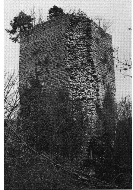
Milandre, Zustand des Turmes um 1979.

Unter der Herrschaft der Karolinger scheint im Jura die Machtstellung des Königs nur schwach ausgebildet gewesen zu sein, und es bleibt unsicher, ob in den noch dünn besiedelten Waldgebieten die karolingische Grafschaftsverfassung überhaupt wirksam geworden