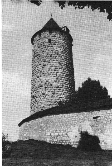
Pruntrut, runder Hauptturm (Mitte des 13. Jahrhunderts).

Die Auflösung des Römerreiches im Verlaufe des 5. Jahrhunderts nach Chr. scheint im Jura wie anderswo einen