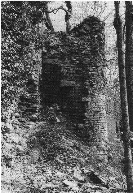
Montvoie, Geschützbastion des 16. Jahrhunderts.