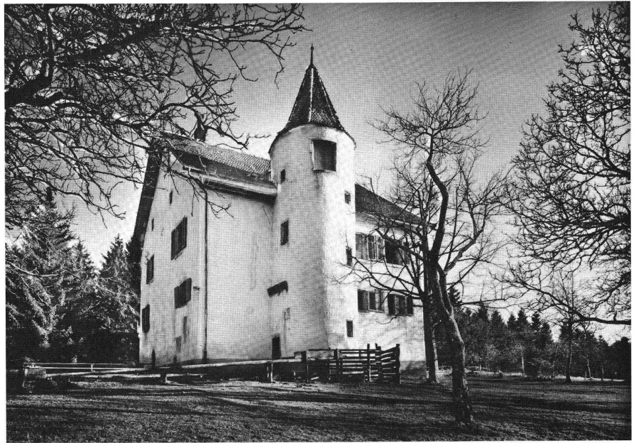
Domont, Zustand um 1930.