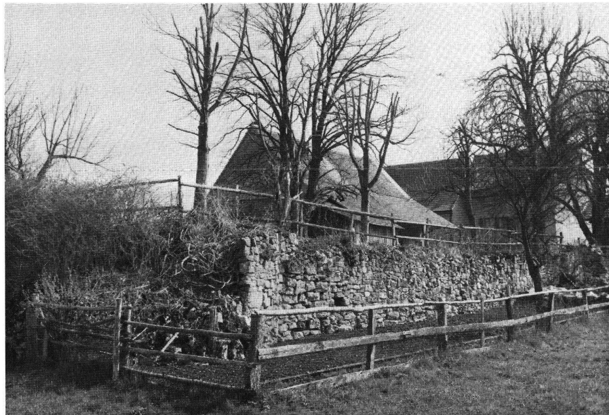
Miécourt, Reste der Wasserburg.