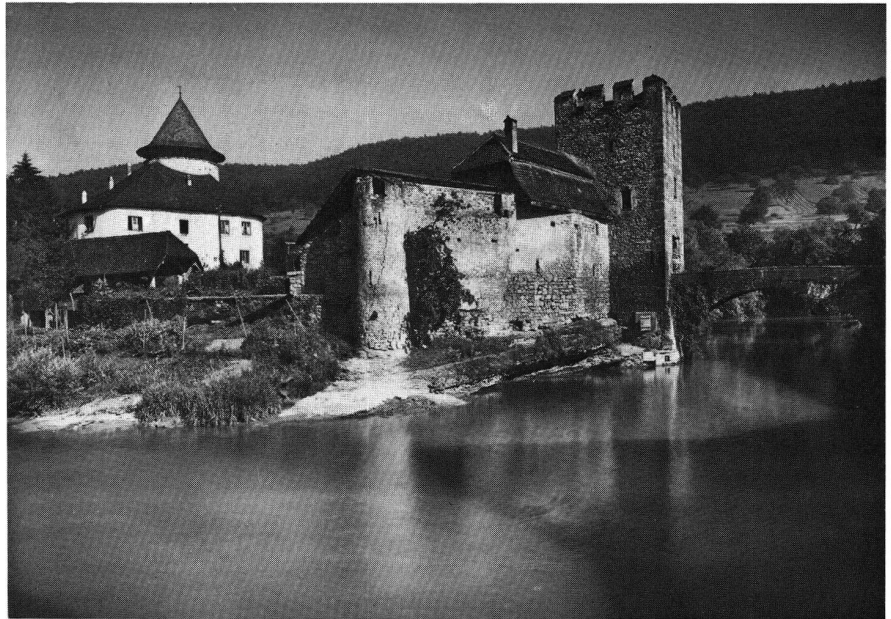
Zwingen, Zustand um 1930.

Um die Wende vom 11. zum 12. Jahrhundert treten uns in den Urkunden erstmals Personen entgegen, die sich bestimmten Geschlechtern zuweisen lassen. Zu den bedeutendsten Familien in der Ajoie zählten offenbar die Freiherren von Asuel, im Birstal die Sippe der Grafen von Saugern und der Freiherren von Pfeffingen. Kleinere Herrschaften befanden sich in den Händen der Freiherren von Pleujouse, von