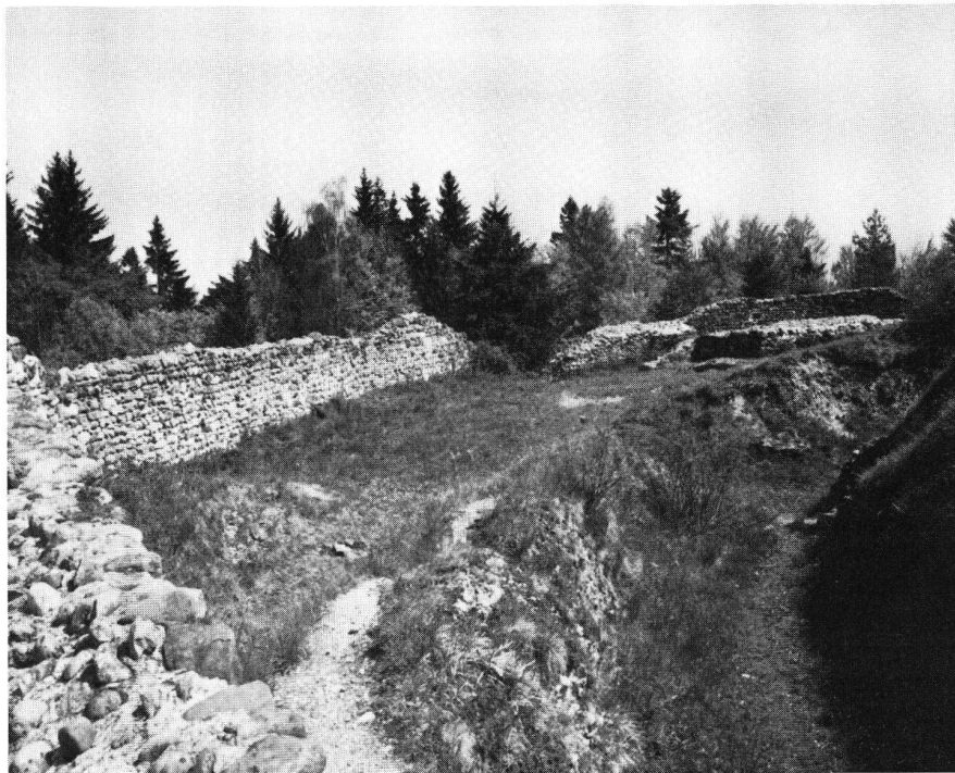
Neu-Toggenburg SG. Burgplatz und innerer Graben von SW.

Im Jahr 1226 erlitten die aufstrebenden Toggenburger einen empfindlichen Rückschlag. Was sich in der Klosterchronik von St. Gallen als verwerfliche Mordtat des machthungrigen Diethelm II. an seinem jüngeren Bruder Friedrich ausnimmt, muss allerdings nach der Interpretation von Bruno