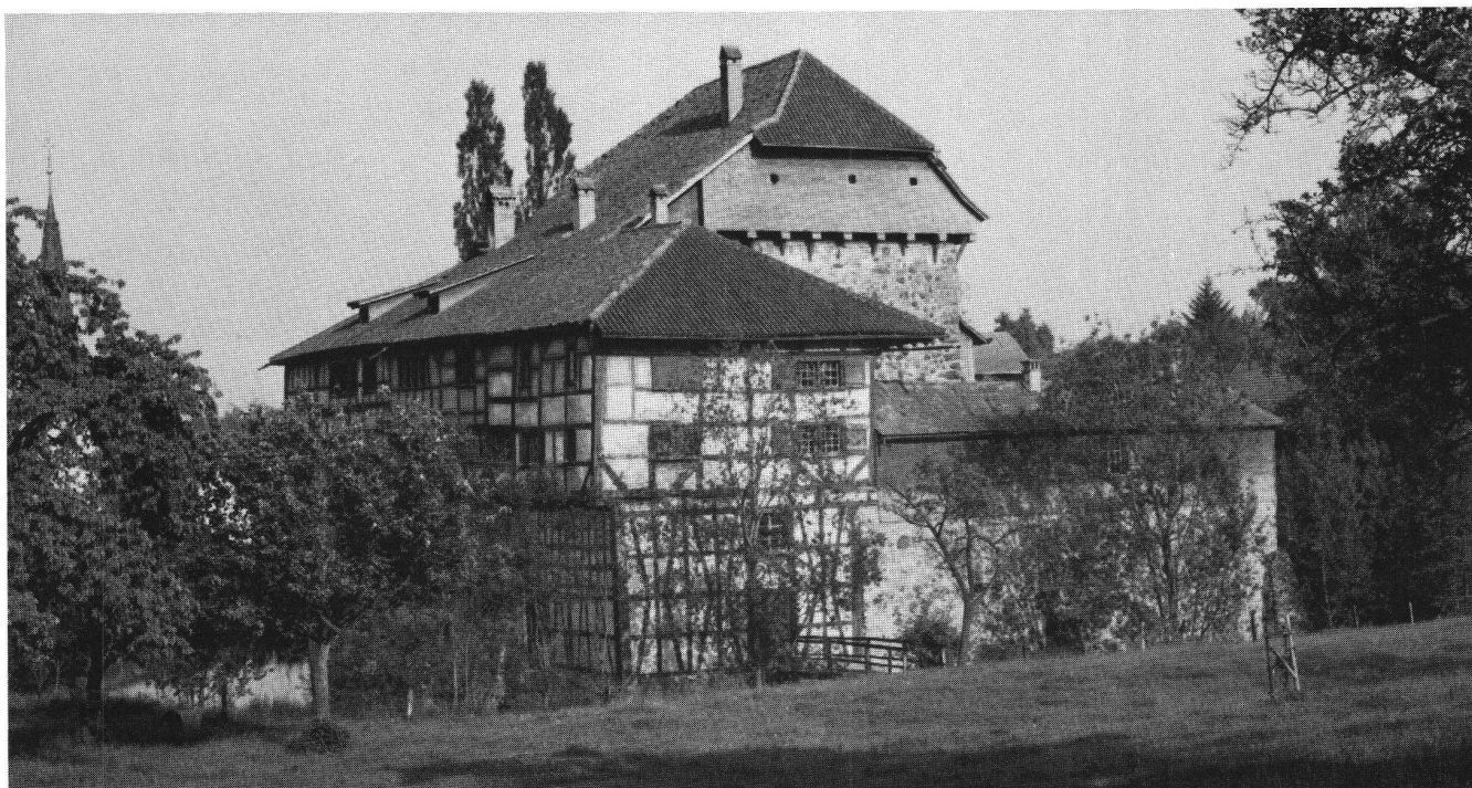
Hagenwil TG. Als ältester Teil der Wasserburg erhebt sich im Zentrum der mächtige Turm mit Walmdach.

der Aufstieg zum mächtigsten Dynastengeschlecht in diesem Raum. Die Heirat mit der Erbtöchter der Freiherren von Vaz brachte reichen Besitz in Rätien, und nachdem die Toggenburger vorübergehend auch die Herrschaften Kyburg, Greifensee und Rapperswil in ihrer Hand vereint hatten, gelang es ihnen, zwischen dem Besitz in der Linthebene und in Rätien die lange angestrebte Brücke zu schlagen. Mit dem Erwerb weiterer Teile des Rheintals und Vorarlbergs zeichnete sich bereits eine neue Stossrichtung der toggenburgischen Territorialpolitik ab. Da starb Friedrich VII. 1436 kinderlos auf der Schattenburg zu Feldkirch. Unterdessen strebten auch die Äbte des Klosters St. Gallen zielbewusst die Schaffung eines zusammenhängenden Herrschaftsgebietes an. Stärker als die Toggenburger stützten sie sich dabei auf ihre Dienstleute ab, deren Burgen sich als breites Band aus der Gegend von Wil mit Zuckenriet, Löwenberg (Leuenberg), Schenken- und Gielen-Glattburg bis in die Gegend von Rorschach, ja bis nach Altstätten hinzogen. Ein äbtisches Verzeichnis aus der ersten Hälfte des 14. Jahrhunderts zählt 72 Dienstleute und 27 Burgen des Gotteshauses St. Gallen diesseits des Bodensees auf. 9 In den meisten Fällen handelt es sich bei diesen Burgen um einfache, von einer Ringmauer um-