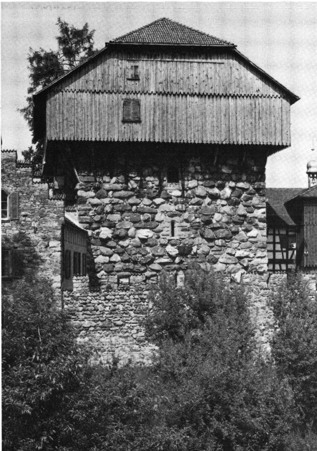
Mammertsbofen TG. Wohnturm mit vorkragendem Oberboden von SW.