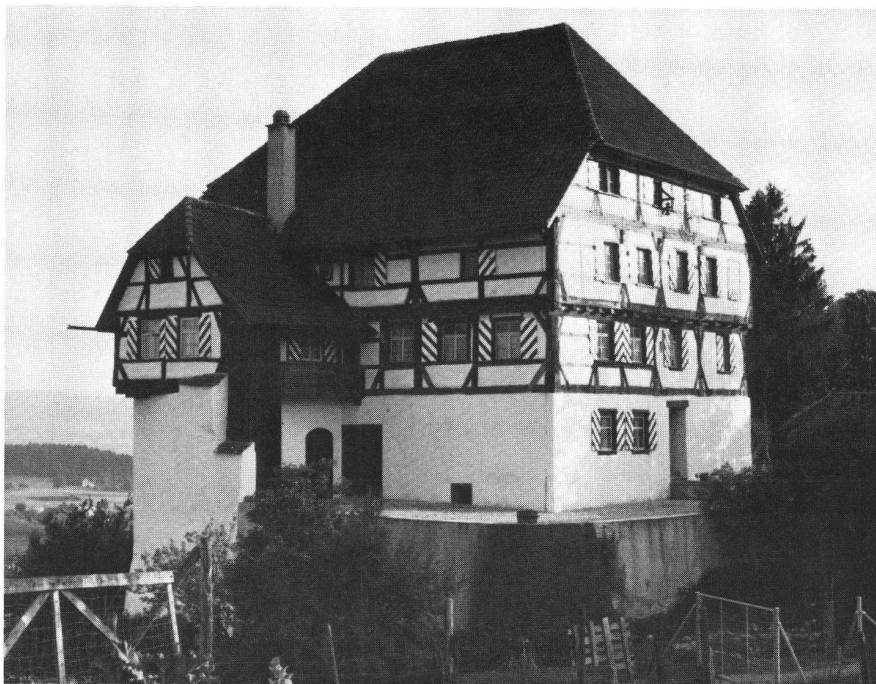
Zuckenriet SG von NE.

krieg, stand auch der Abt auf der Seite der Schwyzer. Noch bevor die Eidgenossen 1460 mit der Eroberung des Thurgaus die habsburgischen Pläne in diesem Gebiet endgültig durchkreuzten, hatte der Abt mit Zürich, Luzern, Schwyz und Glarus ein ewiges Burg- und Landrecht abgeschlossen. Dem rührigen Abt Ulrich Rösch, der sich sehr häufig in Wil aufhielt und der auch dem «Hof» im wesentlichen sein heutiges Aussehen gab, gelang es endlich, von Wil bis Rorschach ein geschlossenes Fürstentum, das sogenannte Fürstenland zu schaffen, in dem einzig die Stadt St. Gallen ein eigenständiges politisches Gebilde darstellte. Mit dem Ankauf des gesamten Toggenburgs von Petermann von Raron, einem Verwandten des letzten Toggenburgers, wuchs das äbtische Gebiet nochmals um mehr als das Doppelte. Gegenüber den eindrücklichen Landvogteischlössern der eidgenössischen Stände nahmen sich die äbtischen Verwaltungssitze wie Oberberg, Schwarzenbach oder Iberg sehr bescheiden aus.