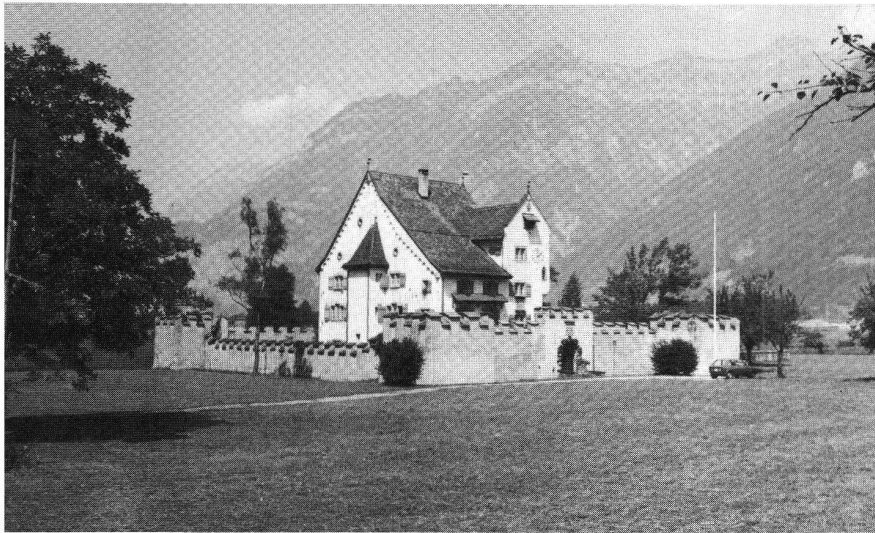
Schloss A Pro, um 1556 in Anlehnung an die mittelalterliche Burgenarchitektur errichtet.