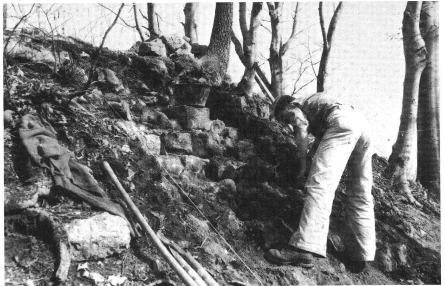
Altenberg BL, Freilegung des Mauerwerks in Schnitt F10.

pauschalen urkundlichen Nennung schwer fassbaren Burgengründungen des Bischofs Burkart von Fenis († 1107) gehören könnte 10 . Diese Anlagen sind während des Investiturstreites entstanden und dürften im 12. Jahrhundert wegen des Überganges der bischöflichen Herrschaftsrechte an regionale Machthaber hochadligen Standes bald wieder eingegangen sein 11 . Abschliessende Aussagen sind in dieser Frage selbstverständlich noch nicht möglich. Dass eine Weiterführung der Grabungen auf dem Altenberg von höchstem burgenkundlichem und historischem Interesse wäre, dürfte durch die bisherigen Forschungsergebnisse hinlänglich klar geworden sein.