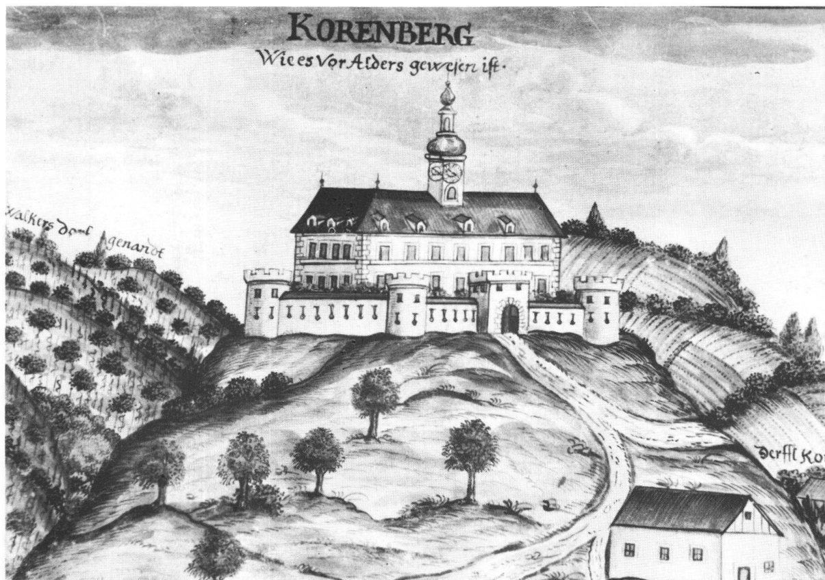
Kornbach bei Feldbach.

In der gotischen Katharinenkapelle des Südtraktes sind Fresken des 14. Jahrhunderts freigelegt worden. Die Weinproben in den gewaltigen Kellergewölben waren nicht weniger genussreich als die baugeschichtlichen Eindrücke.