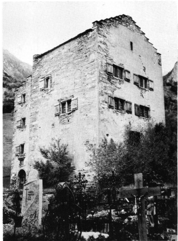
Raron, Turm des Viztums