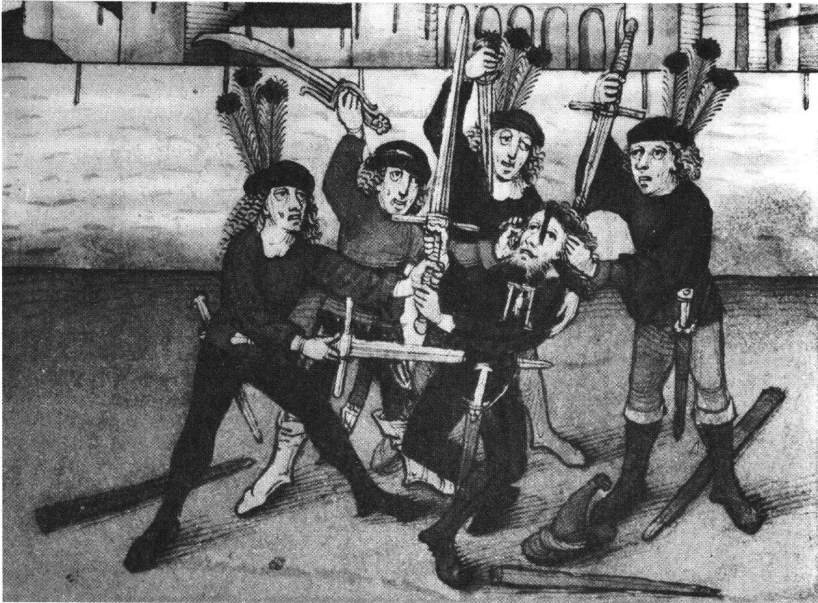
Blutrachemord. Angeworbene Söldner aus dem Wallis erschlagen den Henker von Bern. Nach der Spiezer Chronik des Diebold Schilling, Taf. 328

Privatkrieg. Einen Staat im heutigen Sinne des Wortes hat es im Mittelalter nicht gegeben, und die Gerichte, soweit solche überhaupt bestanden und als zuständig galten, hatten oft Mühe, ihrem Urteilsspruch Achtung zu verschaffen, und mussten den Vollzug des Urteils dem Kläger selbst überlassen. Diesem blieb, wenn der Beklagte den Richterspruch nicht anerkennen wollte, nichts anderes übrig, als seine vom Gericht anerkannten Forderungen mit Hilfe eines privaten Krieges, einer Fehde, durchzusetzen. Wegen ihrer mangelnden Autorität wurden die Gerichte in vielen Fällen überhaupt nicht bemüht, sondern der Geschädigte suchte sein Recht von vornherein in der Fehde. Deren Ausmass hing von der Bedeutung der Streitsache, von der Anzahl und dem Rang der beteiligten Personen und der räumlichen Ausdehnung des Konfliktes ab. Getragen wurde die Fehde von den Rechtsvorstellungen der Wiedergutmachung einerseits und der persönlichen Genugtuung, der Rache, anderseits. Bei der ausserordentlichen Empfindlichkeit des mittelalterlichen Menschen auf ehrenrührige Äusserungen kann es nicht befremden, dass auch Ehrverletzungen den Anlass zu Fehden bilden konnten und dass umgekehrt im Falle einer Rechtsverletzung irgendwelcher Art der Geschädigte eine moralische Verpflichtung hatte, die Tat zu rächen, wollte er seine Ehre nicht verlieren.