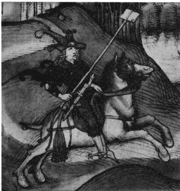
Der reitende Bote des Grafen von Valengin bringt den Bernern den Absagebrief. Nach der Spiezer Chronik des Diebold Schilling, Taf. 112