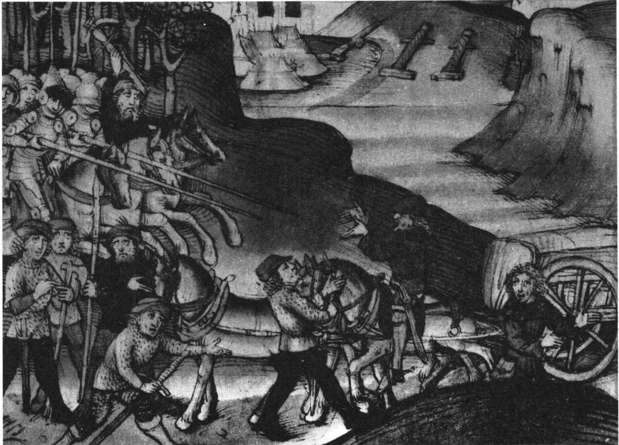
Reisende Kaufleute werden anlässlich einer Fehde überfallen. Nach der Spiezer Chronik des Diebold Schilling, Taf. 175

fangen oder zu vertreiben. Wegen der Banditengefahr schlossen sich die Reisenden häufig zu grösseren Gruppen zusammen und heuerten ein paar Soldknechte an, um sich bei Überfällen besser verteidigen zu können.