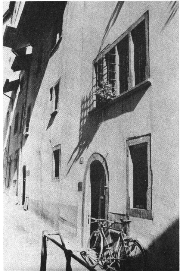
Das “Burgenarchiv” am Stapfelberg

Einige tausend Fotos und Postkarten von Burgen und Schlössern des In- und Auslandes warten in zahlreichen Kästen auf ihre Neuentdeckung. Ebenso ergeht es über 1000 Djapositiven, die für Lichtbildervorträge zur Verfügung stehen.