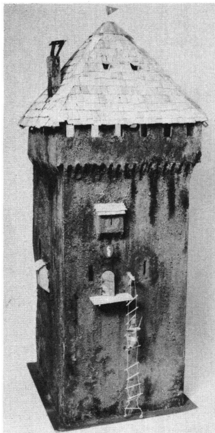
Idealkonstruktion eines Wohnturms von vorne (1. Preis des Jugendwettbewerbes)