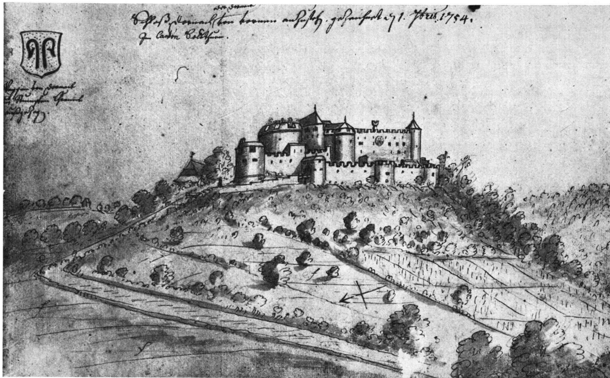
Dorneck, nach E. Büchel (Mitte 18. Jahrhundert)

brechen, sondern auch weil sie selbst für die meisten Ritterburgen keinen Verwendungszweck hatten. Eine Ausnahme bildeten jene Anlagen, die als Zentren der Landesherrschaft zu Landvogteisitzen umgebaut wurden.