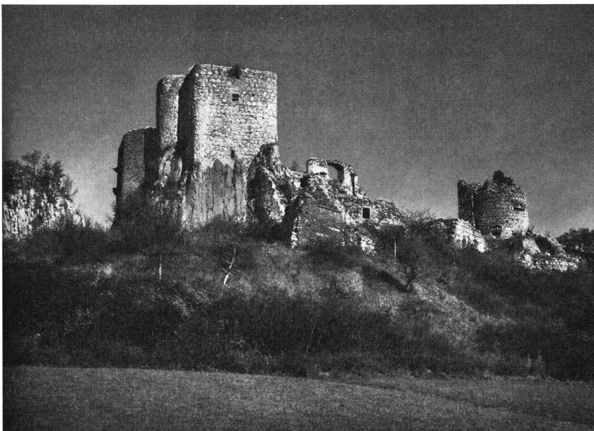
Landskron, Anblick von Südwesten. Wohnturm (13. Jahrhundert), Erweiterungsbauten (um 1515) und Trümmer der französischen Festung (Ende 17. Jahrhundert)