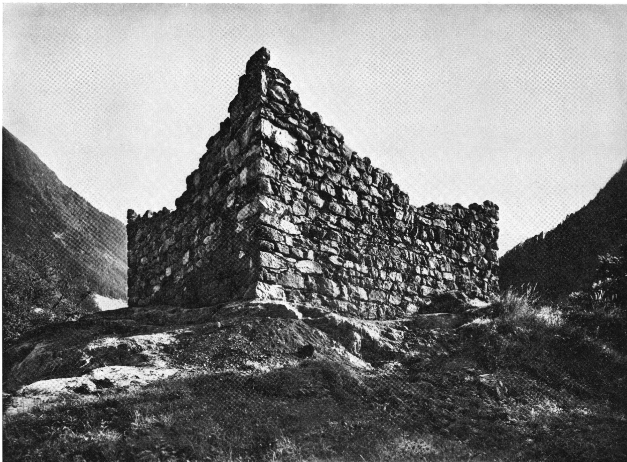
Ruine Zwing-Uri UR. Besitz des SBV, kann am 8. September besucht werden.

14.30 Fahrt über Attinghausen und Schweinsberg nach Seedorf. Besuch der Klosterkirche und des Schlosses A Pro. Begrüssung durch den Regierungsrat des Kantons Uri.