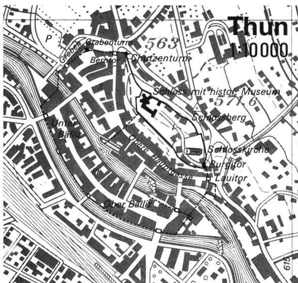
Einfarbiger Ausschnitt aus einer Detailkarte 1 : 10 000. In farbigem Überdruck sind alle historischen Wehrbauten festgehalten.

Reproduziert mit Bewilligung der Eidg. Landestopographie vom 4.9.1973