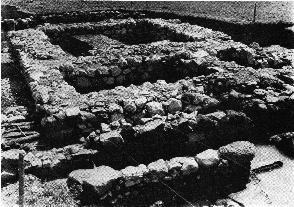
Wasserburg Mülenen SZ. Turm, Ansicht von Westen.