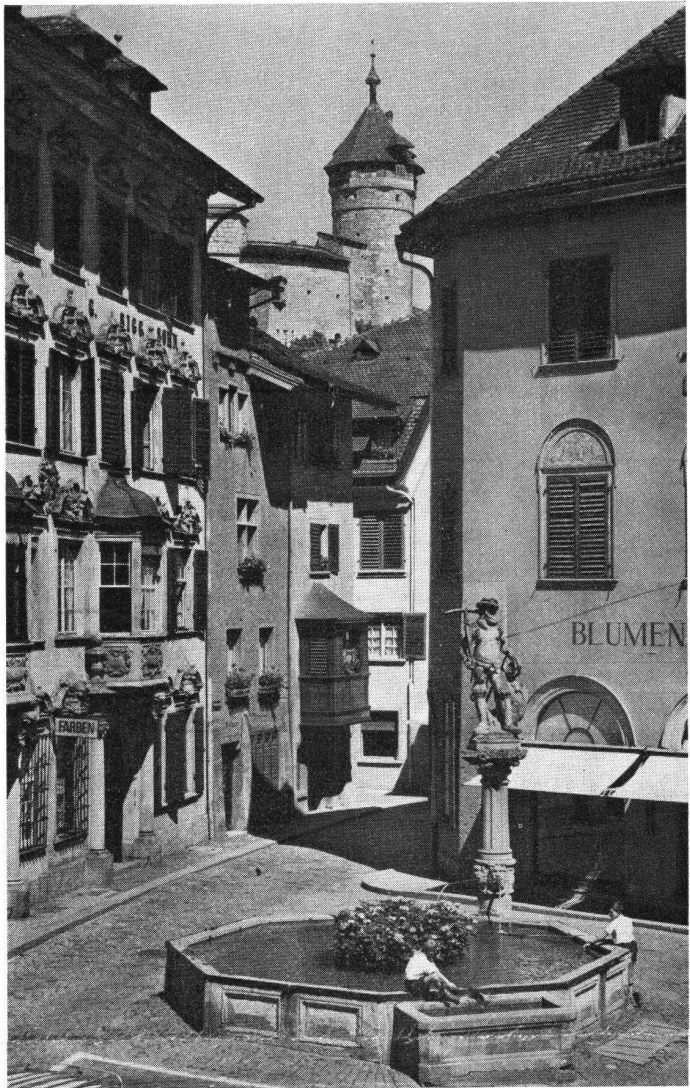
Schaffhausen Blick aus der Vorgasse in die Brunnengasse; eines der markantesten Straßenszenen der Innenstadt. Vorne der Tellenbrunnen aus der Mitte des 17. Jahrhunderts. Links davon das prachtvolle, 1738 durch Franz von Ziegler von Waldkirch erbaute Doppelhaus zur Wasserquelle und zur Zieglerburg mit seinem reichen Fassadenschmuck. Im Hintergrund der Munot.

Erscheinen jährlich sechsmal XLIV. Jahrgang 1971 8. Band Juli/August Nr. 4