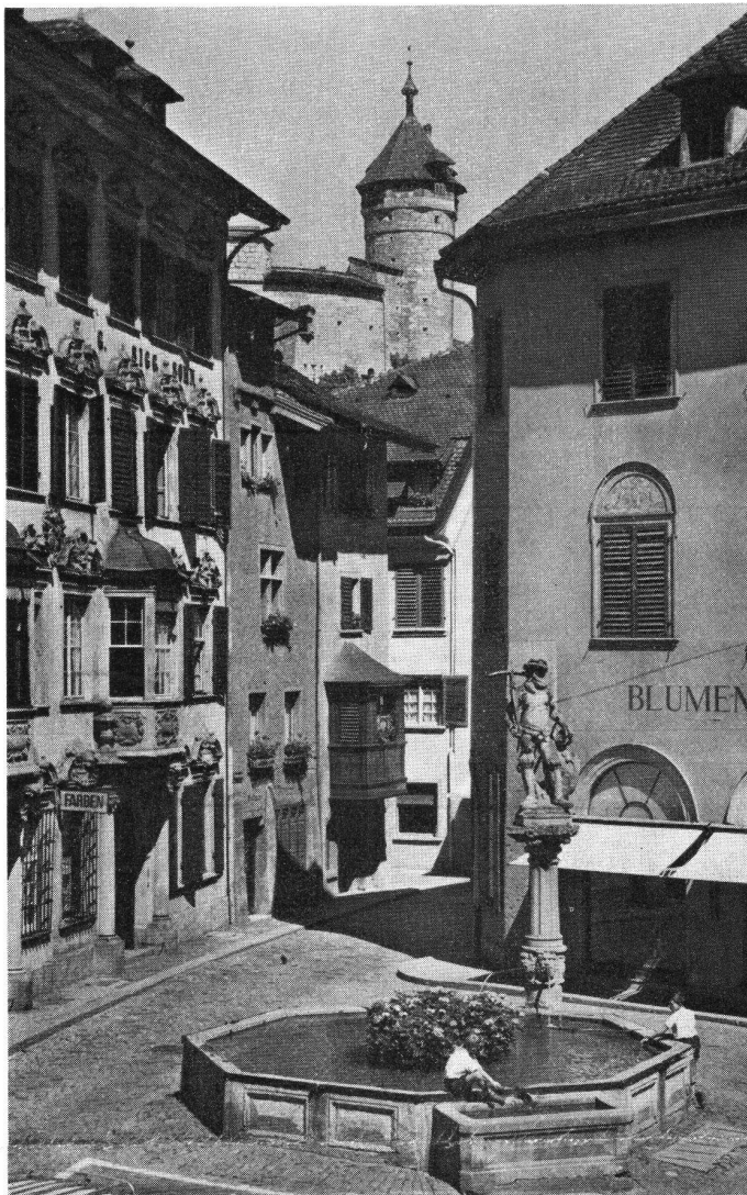
Schaffhausen Blick aus der Vorgasse in die Brunnengasse; eines der markantesten Straßenbilder der Innenstadt. Vorne der Tellenbrunnen aus der Mitte des 17. Jahrhunderts. Links davon das prachtvolle, 1738 durch Franz von Ziegler von Waldkirch erbaute Doppelhaus zur Wasserquelle und zur Zieglerburg mit seinem reichen Fassadenschmuck. Im Hintergrund der Munot.

Erscheinen jährlich sechsmal XLIV. Jahrgang 1971 8. Band Juli/August Nr. 4