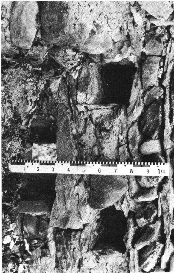
Haselstein GR. Burgruine. SW-Ecke des Palas, innen. Balkenlochlage des dritten Bodens. Darunter Schmalscharte des zweiten Geschosses, halbhoch mit Schutt gefüllt. Aufnahme 1970. Das Bild ist von links zu betrachten.

Unter schriftlicher Bestellung an obgenannte Adresse kann überdies der bereits erschienene Jahresbericht pro 1970 der Arbeitsgruppe bezogen werden.