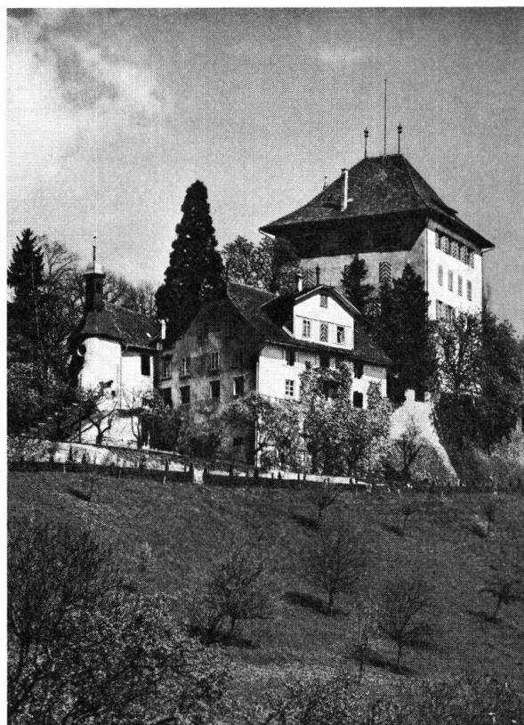
Heidegg LU. Schloß. Ansicht von Süden.

Wird vom Burgenverein am 30. Mai besucht.