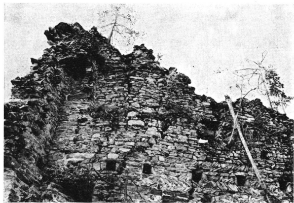
Ober-Tagstein GR Schildmauer. Durch jahrhundertelangen, intensiven Pflanzenwuchs ist das Mauerwerk an zahlreichen Stellen auseinander gesprengt worden. Der Einsturz wird nur noch eine Frage der Zeit sein.

Ahnengalerie und der stimmungsvolle Abend in der Schloßtauerne.