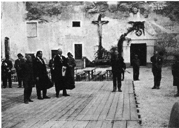
Mailberg, Niederösterreich, Empfang durch den Fürsten Großprior, seinen Kanzler und die Dorfmusik im Hof der Burganlage. Im Hintergrund der Eingang zur Kirche. 3. Mai 1968.

Nach der genußreichen Fahrt entweder mit dem «Transalpin» oder mit dem Flugzeug nach Wien und nach Bezug der einwandfreien und guter alter Hoteltradition entsprechender Unterkunft im «Hôtel de