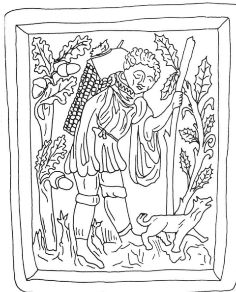
Bauer im Eichenwald. Gebogene Füllkachel, um 1460, 20,5 × 25 cm.

Die Herren von Wädenswil erscheinen 1130 erstmals in den schriftlichen Quellen. Zusammenhänge mit den Herren von Eschenbach scheinen möglich. Die Geschichte der Herrschaft Wädenswil ist interessant, denn eine erste Phase umfaßt die Zeit des Freiherrengeschlechts vor 1287. Nachfolger waren die Johanniter, welche Grundbesitz und Rechte des letzten Freiherrn käuflich erwarben. Das nicht geschlossene Gebiet bildete anfänglich keine selbständige Kommende, sondern es war dem Hause Bubikon unterstellt, erlangte aber um 1330 verwaltungsrechtliche Selbständigkeit. Von da an amtierten in Wädenswil eigene Komturen.