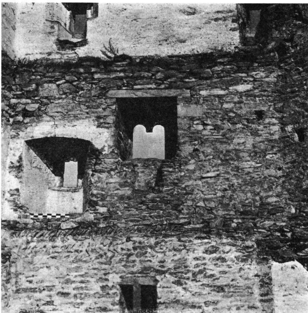
Haldenstein GR Palas E-Innenwand mittl. Drittel

Die Ergebnisse dieser ersten Arbeitsetappe sind zwar noch nicht alle ausgewertet, doch läßt sich jetzt schon erkennen, daß ein außerordentlich reichhaltiges, wissenschaftlich hochinteressantes Dokumentationsmaterial zusammengekommen ist. Dieses befindet sich im Besitz der Denkmalpflege des Kantons Graubünden. Eine Weiterführung der Arbeiten ist durchaus wünschenswert. Tatsächlich hat Dr. A. Wyss die Absicht, auf Grund der Vorarbeiten vom vergangenen Herbst für die vollständige Inventarisierung aller Bündner Burgruinen ein großzügiges Projekt auszuarbeiten. Mit dessen Verwirklichung könnte spätestens im nächsten Jahr begonnen werden, so daß in absehbarer Zeit mit weiteren Ergebnissen zu rechnen ist. W. M.