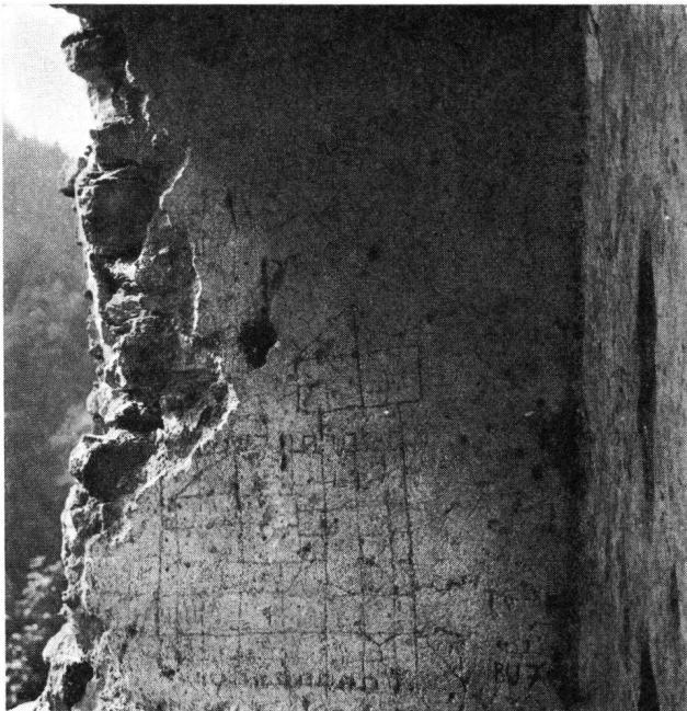
Fracstein GR Wohnbau, Fenster in S-Wand, mit Ritzzeichnungen

spiel mag die Burgstelle Nieder-Realta erwähnt werden, die durch ihren Backofen und ihren Helm weit über die Kantonsgrenzen hinaus bekannt geworden ist. Für die Burgenarchäologie ist der Kanton Graubünden zum größten Teil noch Neuland. Das freilich trifft für die meisten Gegenden in der Schweiz zu. Das Besondere, Einmalige der Bündner Burgen ist in etwas anderem zu suchen.