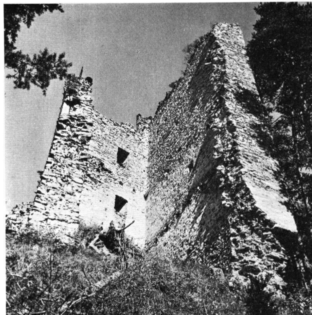
Ober-Ruchenberg GR Turm-Ansicht von SW

Erscheinen jährlich sechsmal XXXVII. Jahrgang 1964 6. Band Jan./Febr. Nr. 1