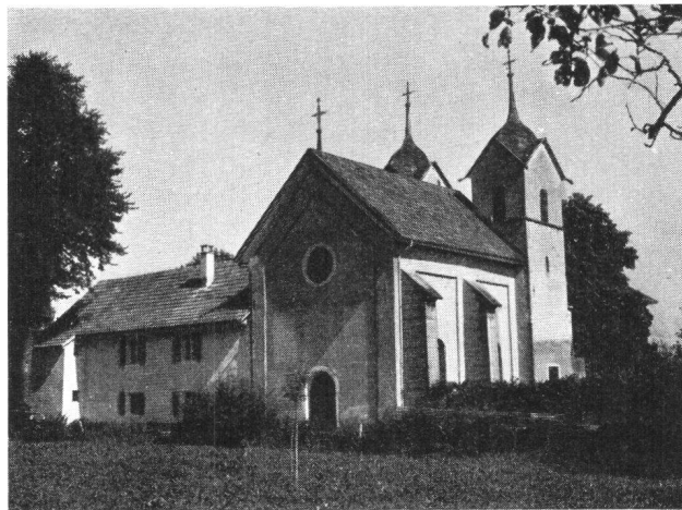
Böttstein AG, Schloßkapelle

Böttstein, unser erstes Ziel, darf wohl unstreitig als der eingangs erwähnte Idealfall gelten. Der heute noch herrschaftliche Edelsitz gehört seit einigen Jahren unse-