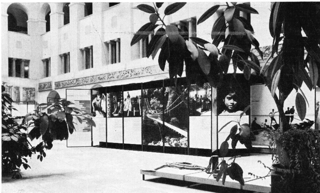
von der Vernissage im Lichthof der Universität Zürich

Auf Lenzburg schlußendlich, wo uns dessen Betreuer, Dr. H. Düst, eingehend mit der Geschichte des mächtigen Grafensitzes vertraut machte, bot sich Gelegenheit, in die Aufbauprobleme eines vor kurzem gegründeten historischen Museums Einblick zu nehmen. Daß beim anschließenden schmackhaften Abendessen im Rittersaal die Stimmung bald hohe Wellen schlug, braucht wohl kaum extra erwähnt zu werden.