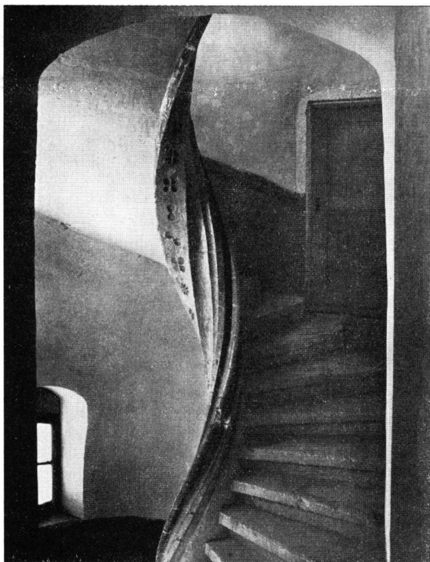
Schloß Pruntrut, Wendeltreppe Residenzgebäude

1961 sind die Restaurierungsarbeiten am Schloß, für welche das Bernervolk am 2. September 1956 einen Kredit von 2 Millionen Franken bewilligt hatte, abgeschlossen worden.