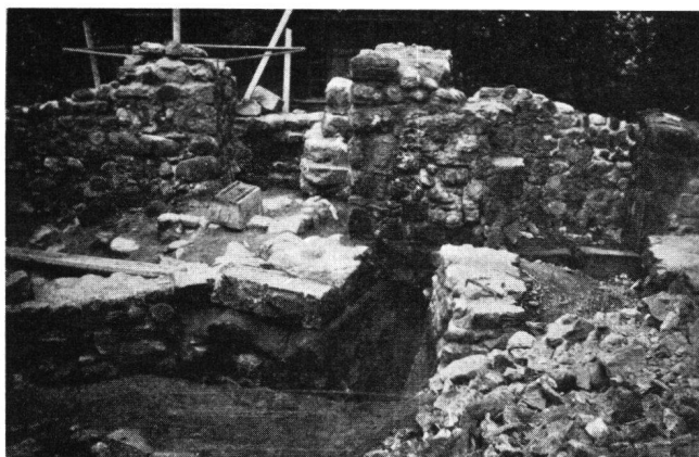
Burgruine Wulp ZH

Im Vordergrund die freigelegte Turmecke, darüber rechts Mauerwerk mit Türe eines Gebäudes der 5. Bauetappe. Im Hintergrund die quer über den Turm führende Mauer mit dem Lattengerüst, welches den Innenraum des Turmes markiert. Die Gebäudeecke ist mit gehauenen Steinen des Turmes aufgemauert