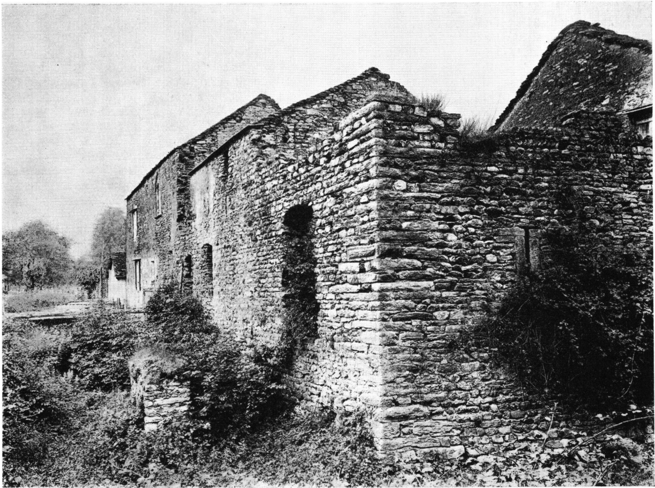
Palazzo Trivulzio in Roveredo GR, Ansicht der NW-Ecke

stattgefunden haben, denn nach der Schleifung der Burg von Mesocco 1526 durch die drei Bünde, bildete der Palast in Roveredo die alleinige Residenz des Trivulzischen Statthalters bis zum Loskauf der Talschaft im Jahre 1549.