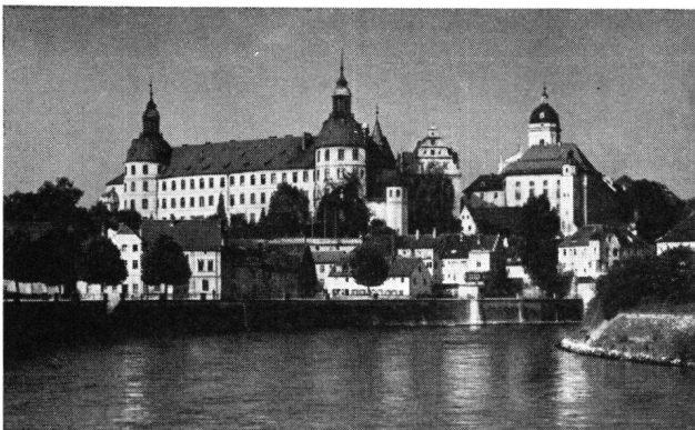
Neuburg an der Donau, die schöne alte Residenzstadt

Zerfall mußte unbedingt vorgebeugt werden. Die total zerstörte Mauerkrone und ein Teil des Palas, der einstigen Ritterwohnung, mußten wohl oder übel abgetragen und rekonstruiert werden.