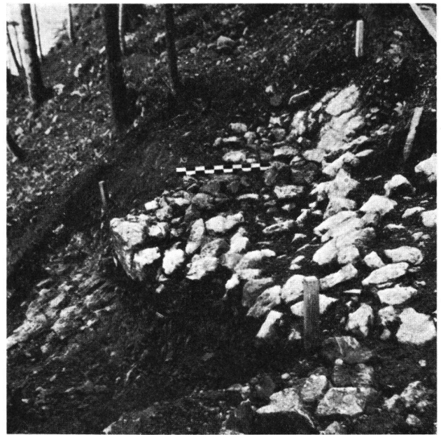
Burg Grenchen, Detailansicht in den Grabungen