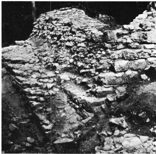
Burg Grenchen, Detailansicht in den Grabungen