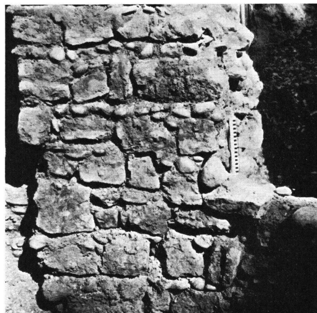
St. Albanvorstadt Basel, Innenmantel des Schalenturmes

Die Befestigung bestand aus einem acht Meter breiten und fast fünf Meter tiefen Trockengraben, und