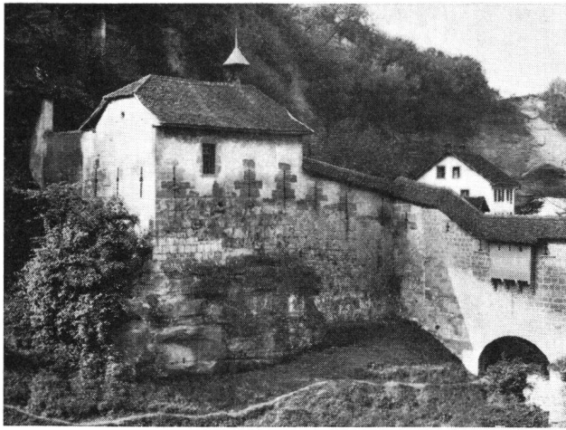
Freiburg Ringmauer. Kapelle St-Béat, nach der Restauration 1937.

au milieu du XIII e siècle. Il estime que c'est un fait remarquable de voir apparaître à Fribourg à cette époque un dispositif de défense qui ne s'est répandu en Europe qu'à la fin de ce siècle. Zemp écrit (op. cit.) que la tour du Durrenbühl a été construite à la fin du XIV e siècle, peut-être en utilisant les fondations d'une tour antérieure.